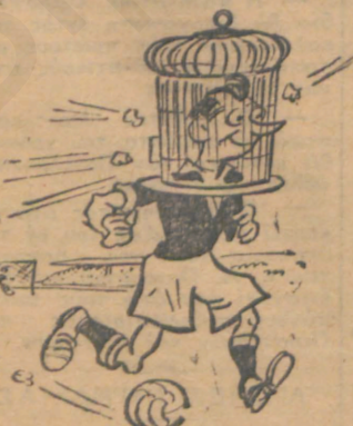
Η καινούργια στολή των ποδοσφαιριστών, μετά τώ πετρώδωλομα της περασμένης Κυριακής.