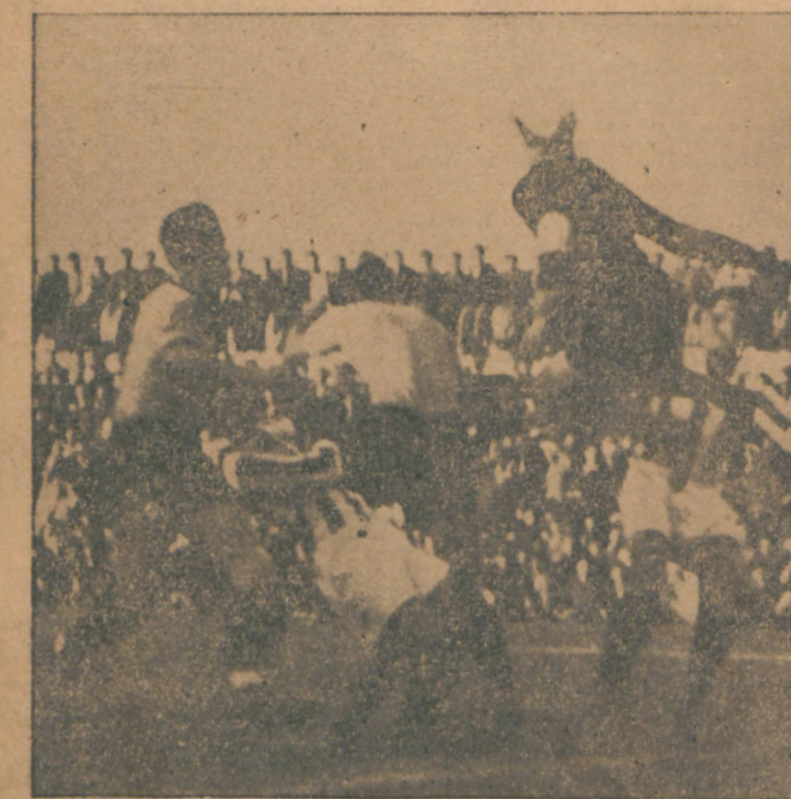
Από το χθεσινό μάτς "Ολυμπιακού" - "Αρεως"

Μέτρον του Πικερμίου ο Φλάς προετρέφον άλλον, προηγουμένως όσον και πύροπαροσθησιν πύροπαρο, όσον και πύροπαροσθησιν πύροπαρο.