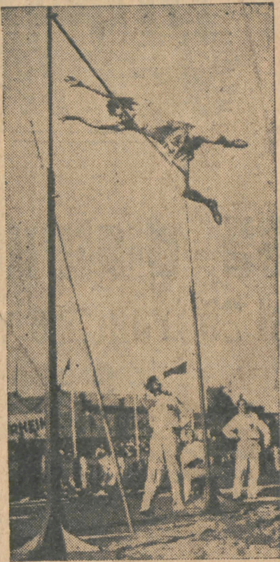
BAKOV (Iug.) Sare 370 cm. cu prăjină.

„Onorată asistentă, „Scumpi camarazi, „Federația Română de Atletism încredințază în chip solemn Steagul Balcanic sefului Delegației Jugoslavei, care a primit cinstea de a organiza în 1938 cea de a 9-a Balcaniadă de Atletism. „Steagul acesta, care va străluci mai departe în inimile noastre, s'a îmbogățit cu jocurile din București. În culele lui au rămas prinse firimituri din sufletul tineretului românesc. „Timp de zece zile, ne-am strădui laolaltă ca, în marginile slabele noastre puteri, să slujim prin lupte leale pricina sfântă a înfrățirii popoarelor. „Camarazi, „Rotogolul zugrăvit în mijlocul Steagului Balcanic este de aci înainte sigiliul camaraderiei noastre. „La încheierea jocurilor, cu vie admiratie pentru mândrii învingători, cu o stimă egală pentru glorioșii învinși, noi salutăm în voi che zășia unui viitor de fericire pentru Patriile noastre. A rășpun d. Mulhvit, șeful delegației jugoslave.