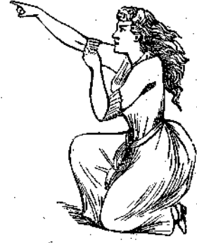
Ὁν. «Αὐτὸς εἶναι» ἀνέκραξε.

Τὸ μεγαλύτερον τῶν μέχρι τοῦδε κατασκευασθέντων θαλεβόλων θεωρεῖται τὸ κατὰ τὸ τρέχον ἔτος 1890 διὰ τὰς ὀχρωσείας τῆς Κρονστάνδης κατασκευασθῆν, ὅπερ ἀποτελούμενον ἐκ διαλελυμένου χάλυβος, εἶχει βάρους 270,000 λίτρας (120 τόννου). Ἡ ἔνδον αὐτοῦ διάμετρος εἶναι 16 \frac{1}{4} δακτύλων, ὁ δὲ μυχὸς τοῦ αὐλοῦ (ὁ δεχομένου τὴν πυρρίτιν καὶ τὴν σφαιραν) εἶχει 44 ποδας μήκος, ἤτοι 13 μ. 42 ἐν ἐνὶ τεμαχίῳ. Ἡ μεγαλιτέρα αὐτοῦ διάμετρος εἶναι 6 \frac{1}{2} ποδῶν, ἤτοι 1 μ. 982. Ἡ βολὴ αὐτοῦ ὑπελογίσθη εἰς 12 μίλια, ὅπερ ἰσοδυναμεῖ πρὸς 19 χιλιόμετρα. Ρίπτει δύο βολὰς καθ' ἑκατοντον λεπτὸν τῆς ὥρας, ἐξ ὧν ἐκάστη στοιχίζει 300 λίτρας (7, 500 φρ.) Κατὰ τὰς γενομένας δοκιμασίας τὸ βλήμα μήκους 1 μ. καὶ 20, βάρους 1,180 χιλιῶγρ. ἐρίφθη διὰ πυρρίτιδος 317 καὶ 50 χιλιῶγρ. καὶ ἀφ' οὗ διετρώπησε θώρακα 48 ἑκατοστομέτρων, διέτρεξεν ἀπόστασιν ἐκ 1,200 μέτρων.