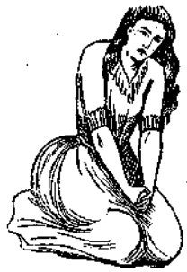
Ὁν. Γορυπετῆ καὶ ὀδύρεται.

νά υποκριθῆ μετὰ τὸς αὐτὴς τελειότητος κινήσεων καὶ αἰσθημάτων, τὰ ὅποια ἡ υποκριτρία παρίστανε τὸσφ φυσικώτερον, ὅσφ πραγματικῶς ἤσθάνετο αὐτά. Μετὰ τινὰς στιγμὰς καταπαύσεως τῆς παραχῆς, καθ' ἣν τῆ ἐπιβλῆ κόπος καὶ ἐντελῆς ἀπελπίσει, ὡς παρίστανε ἡ πέμπτη εἰκὼν, τῆ ἐγγωστοποιήθη ὅτι ὁ κλέπτης τοῦ τέκνου τῆς ἡτο εἰς τὴν ὑπηρετῶν, ὅστις εἰσῆρχετο κατ' ἐκείνην τὴν στιγμήν ἐν τῇ αἰθούσῃ. Αὐτοστιγμὴ τότε αὐτὴ διευθύνεται σύσσωμος πρὸς τὴν ὑποδειχθεῖσαν διευθύνειν, ἐξ ἧς ἤρχετο ὁ φαντασιώδης κλέπτει; καὶ διὰ μὴχανικῆς τινος ἐνεργείας, αὐτὸς εἶναι ἀνεκράξει καὶ ταύτοχρόνως ἀνεπήδησε κατ' αὐτοῦ μετ' ἀπεριγράφτου ὀρμῆς, ἦν μετὰ κόπου πολλοῦ κατήρθωσεν ν' ἀναχατισθῶσι οἱ περὶστῶτες. Ἐξῆτι δ' ἐπιμόνωσ νὰ σταλάσῃ τὸν κλέπτην καὶ νὰ τοῦ ἐξαυξῇ τοὺς ὀφθαλμούς. Αἱ δυνάμεις αὐτῆς εἶχον δεκαπλασιασθῆ, ἀνεκράυγαζε σπαραξικαρδίως, καὶ ἐδέησε νὰ προκλήθῃ ὁ ἐνεργῶν καὶ διευθύνων τὴν ὑπνωτισθεῖσαν δυστυχῆ, νὰ καταπαύσῃ τὴν κρίσιν ταύτην, ὅπερ καὶ ἐγένετο περὶ πρῶτον διὰ μόνης τῆς ἐνεργείας τῆς διανοίας αὐτοῦ.