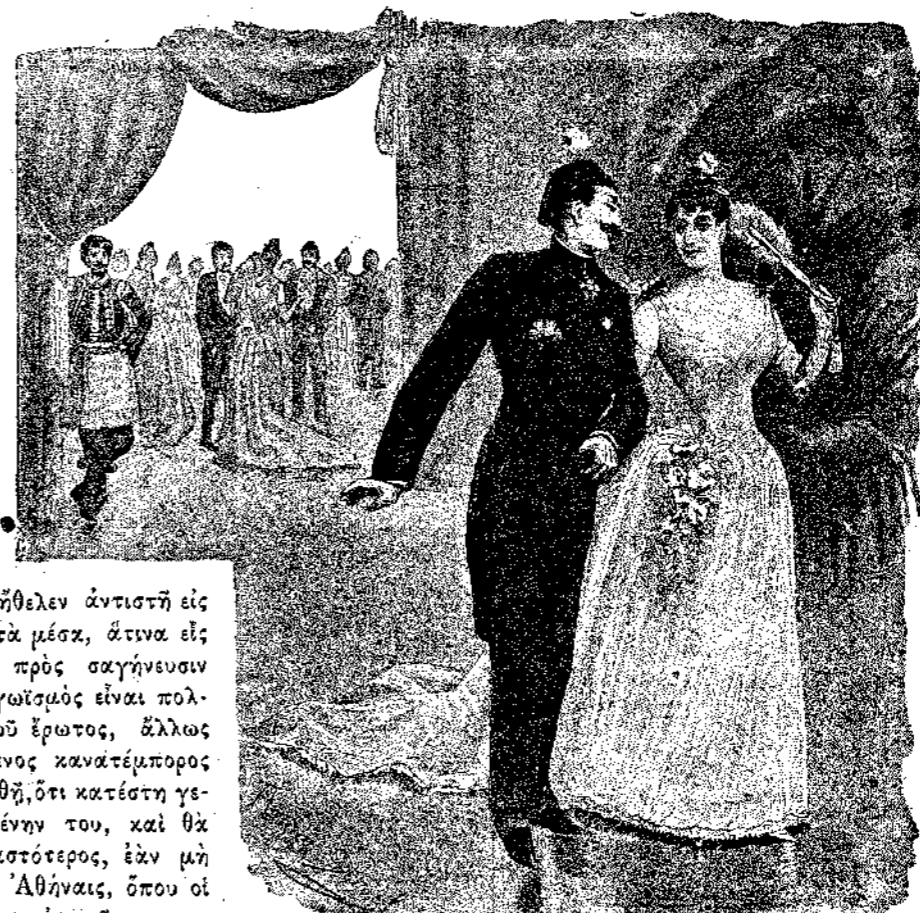
Και βλέπω τις ἀμφοτέρους κρατούμενους διὰ τῶν χειρῶν....

Ὁ κ. Βουγᾶς ἐμάντευσεν, ὅτι ὁ διορισμὸς τοῦ Φώτη βῆ δὲν προῆλθεν ἐκ τύχης, και ὅτι τὸ Φανάριον εἶναι τὸ σχολεῖον τῆς διπλωματίας. Πληροφωρηθέντος δὲ τοῦ διοικητοῦ τῆς Χίου, τῶν ἐπὶ τῷ συνοικισμῷ τῶς ἐξαδέλφης αὐτοῦ ἀναφερόσων διαστάσεων και δυσχε-