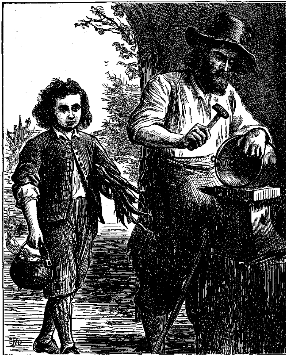
Ο παῖσ οὗτοσ παιδιόθεν ἦτο πεπρωικισμένος...

Ἀντιθέτωσ πρὸσ τὰσ προσπάθειασ τῶν συμπατριωτῶν αὐτοσ, οἵτινεσ πειρῶνται νὰ ἐφαρμόσωσι τὸν ἠλεκτρισμόν ὡσ μέσον θανατώσεωσ, ὁ διάσημοσ ἀμερικανόσ ἐφευρέτησ προσπαθεῖ νὰ χρησιμοποίησ αὐτόν ὡσ ζωογόνον καὶ παυσίνοσον στοιχείον. ὅπως εὐεργετήσ κατ' ἄλλον τρόπον καὶ πολλῶν κάλλιον τὴν ἀνθρωπότητα, ἐφήρμοσε δέ πρῶτοσ τὸν ἠλεκτρισμόν εἰσ τὴν ἀρθρίτιδα κατὰ μέθοδον ὅλωσ νέαν, περὶ ἧσ ὑπέβαλεν ἤδη ἔκθεσιν εἰσ τὸ ἐν Βερολίνω ἐπ' ἐσχάτων συνέδριον. Ο Έδισων συνέλαβε τὴν ἰδίαν νὰ ποιήσῃται χρῆσιν τοσ ἠλεκτρικοῦ ρεύματοσ, ὅπως θέσῃ ἔξωθεν τὸ φάρ-