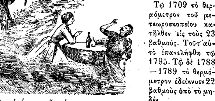
Ἀποτελέσματα μετὰ τὴν εὐμένειαν τῆς τύχης.

Ἐν Παρισίῳ οὐχ ἧττον ἐνέσκηψε ψυχὸς πόλλῶν δριμυτέρων τοῦ κατὰ τὸ ἔτος τοῦτο ἐπισκήψαντος. Τῷ 1709 τὸ θερμόμετρον τοῦ μετεωροσκοπίου κατήλθεν εἰς τοὺς 23 βαθμοὺς. Τοῦτ' αὐτὸ ἐπανελήθη τῷ 1795. Τῷ δὲ 1788—1789 τὸ θερμόμετρον ἐδείκνυεν 22 βαθμοὺς ὑπὸ τὸ μηδέν.