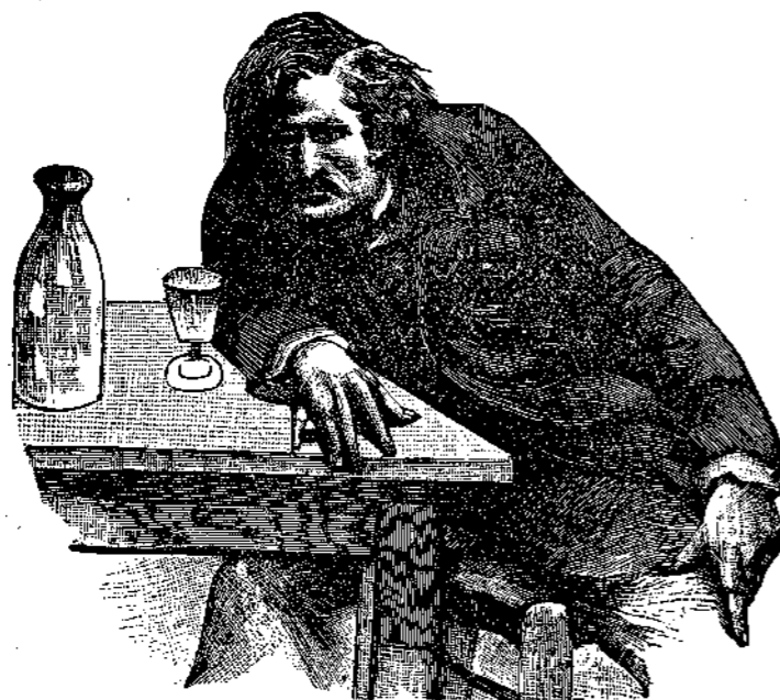
Ἀποτελέσματα μετὰ τὴν δυσμένειαν τῆς τύχης.

Αἱ εἰκόνες, ἅς κατωτέρω δημοσιεύομεν, παριστώσι πιστῶς τὰς φοβεράς φάσεις τῆς ἠθικῆς καὶ οἰκονομικῆς καταπτώσεως καὶ καταστροφῆς τῶν χαρτοπαικτῶν, παραδιδόντων ἑαυτοῦς, εἴτε ὑπὸ ἐπιθυμίας κέρδους ἀθεμίτου, εἴτε προφάσει εὐαρέστου ἐνασχολήσεως, εἰς τὴν σκληρὰν καὶ εἰρώνα τύχην. Μέχρι τοσοῦτου δὲ βαθμοῦ φθάνει ἀκαταλογίστως ἡ προαγωγή τοῦ ὀλεθροῦ τούτου παίγνιου, ὥστε καὶ αὐτὴ ἡ πολιτεία ἐν τῇ ἀστυνομικῇ διοικήσει τῆς χώρας ἀδυνατεῖ ν' ἀναχαιτίσῃ τὴν ὀρμὴν τοῦ κακοῦ. Διὸ μετὰ λύπης βλέπομεν πόλλας καὶ ἐν τοῖς καφεπωλείοις καὶ ἐν ταῖς ὁδοῖς παῖδας ἀναμιξί μετὰ πάσης τάξεως καὶ ἡλικίας ἀνθρώπων παραδιδομένους εἰς τὴν διάκρισιν τῆς τύχης, οἰκτρὰς δὲ τὰς συνέπειας καὶ φρούδους τὰς ἐλπίδας τῶν γονέων. Ποῖοι δὲ μοιροῖ μῆτερες δὲν ἐκλαυσαν τοὺς υἱοὺς τῶν! Ποῖοι νεαροὶ σύζυγοι δὲν ἐθρήνησαν τὴν οἰκογενειακὴν καταστροφήν ἐνεκα τῶν εἰς τὸ παίγνιον τοῦτο ἐδότων ἀνδρῶν κούτων!