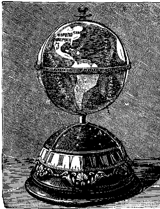
ΠΑΓΚΟΣΜΙΟΝ ΑΣΤΡΟΝΟΜΙΚΟΝ ΕΚΚΡΗΜΙΣ

Χρυσοῦς κύκλος διηρημένος εις 360° παρίσθη τόν ίση- μερινόν, οὔτινος τό Ο εύρίσκηται επί του τοπικοῦ μεσημβρι- νοῦ, εις τρόπον ώστε τά γεωγραφικά μήκη δύνανται κατά βούλησιν, να μετρῶνται, άρχήν ποιούντες άφ' οιοιδήποτε σημείου, λογιζομένου ως άρχικοῦ μεσημβρινοῦ. 'Ο κινήτός και ανεξάρτητος μεσημβρινός Μ, έκδεικνύσι τά γεωγρ. πλάτη και τās ζώνας, ών αι άποστάσεις δηλοῦσι τοῦς τροπικούς και τοῦς πολικούς κύκλους. Τά δε γεωγρ. μήκη, ών αι ώραι έν- δείκνυνται διά τής βελόνης μ του κινητοῦ μεσημβρινοῦ, ά-