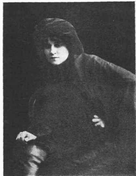
Ἡ Ἀμερικανὴς ὑψίστης δεσποινίς Ἔθελ Χάρριγκτον

— Ὑπὸ τοῦ Ὑπουργοῦ τῶν Στρατιωτικῶν ἠγοράσθη ἐν ἐκ τῶν καλλιτέρων ἔργων τοῦ νεαροῦ ζωγράφου κ. Μιχελιδάκη, παριστάνον γλέντι στρατιωτῶν, οἱ ὅποιοι νοσηρῶς βλέπουν τὸν Ἀρχιστρατήγον Βασιλέα σπεύδοντα πρὸς τὴν μάχην καὶ στεφανούμενον