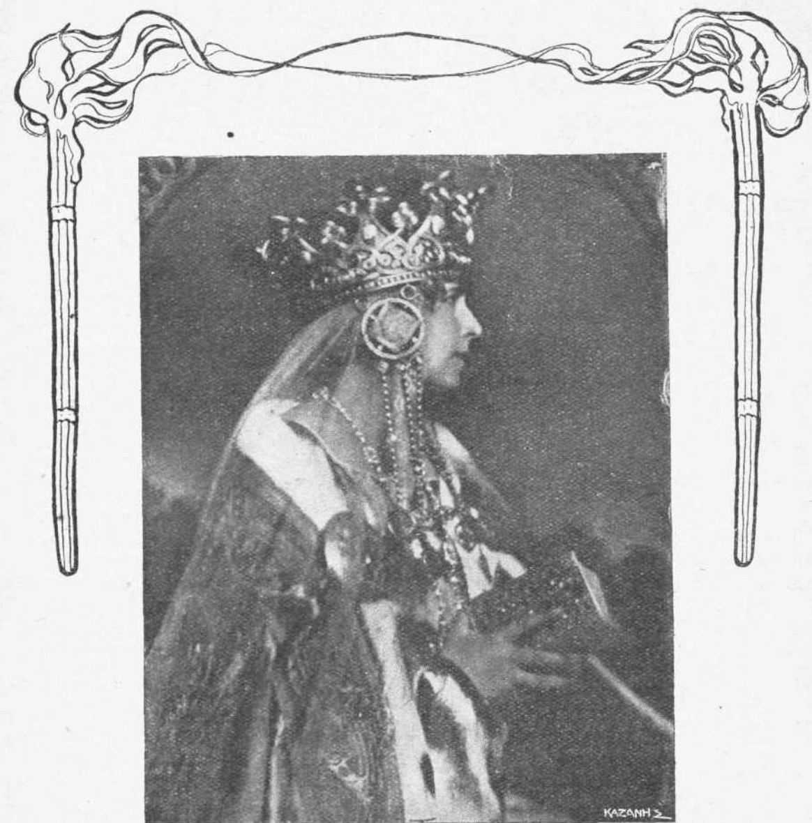
Η Α. Μ. Η ΒΑΣΙΛΙΣΣΑ ΤΗΣ ΡΟΥΜΑΝΙΑΣ ΜΑΡΙΑ

Ὁ γραμματεὺς τοῦ ὑπουργείου τῶν Ἐξωτερικῶν κ. Ι. Λογγοβάρδος ἐξέδωκε ὑπὸ τὸν τίτλον «Ἐθνομυθία τῶν ἑλληνικῶν παρασημῶν», Ἀριστεῖον καὶ Μεταλλεῖον λεύκωμα, περιέχον λιθογραφημένους πίνακας, Β. Διατάγματα, ὁδηγίαι περὶ τοῦ τρόπου τοῦ φέρειν τὰ παρασημῶν, περὶ ἐθνικῶν ἑορτῶν καὶ τελετῶν κλπ. Εἶνε τὸ πρῶτον βιβλίον τοῦ εἶδους του, τὸ ἑποῖον ἐκδίδεται ἐν Ἑλλάδι.