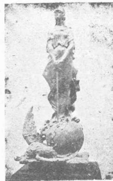
Είς οίωनों άριστος άμύνεσθαι περί πάτρης. Γλυπτικόν έργον Γ. Συνέφα.