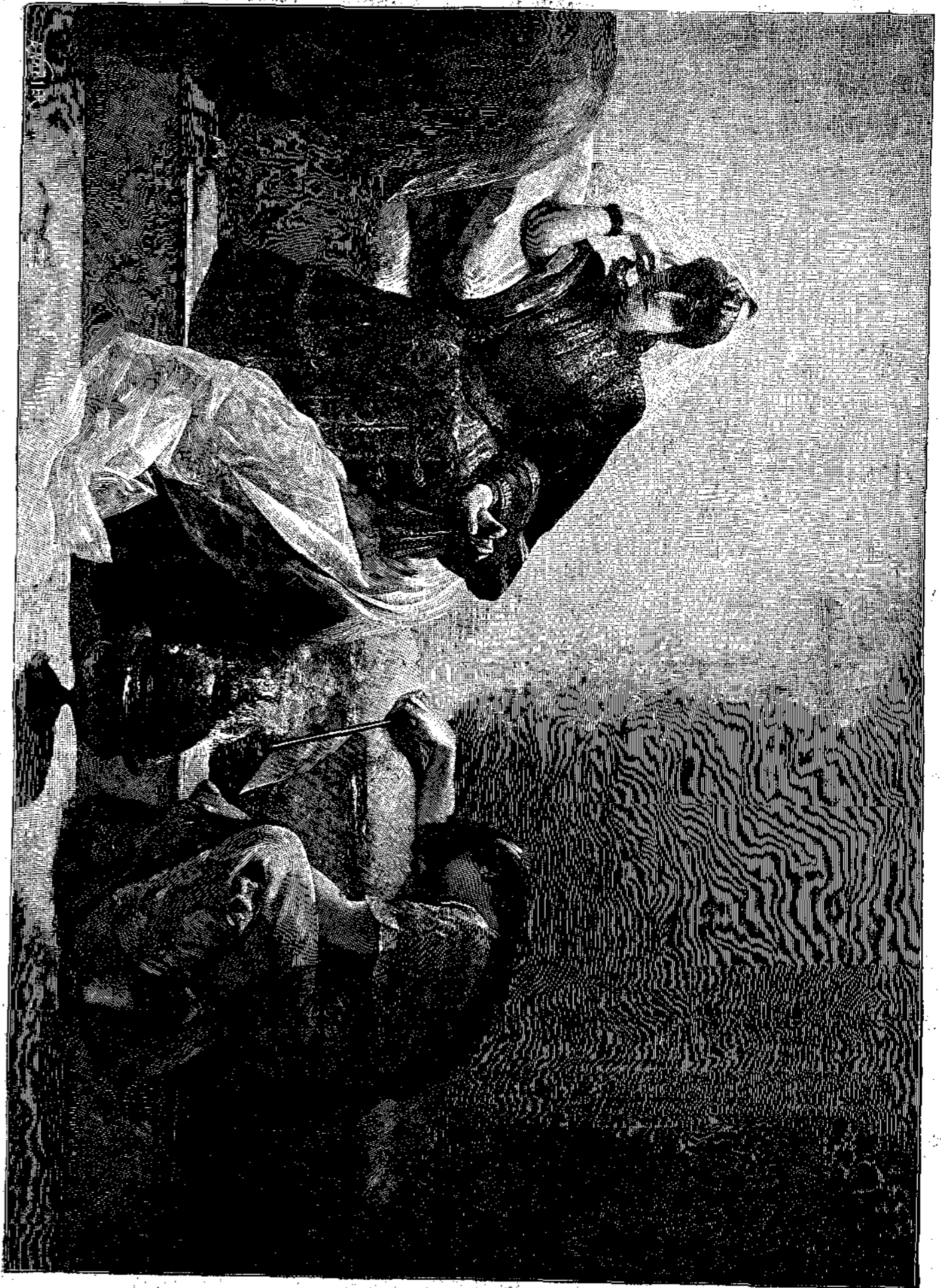
Η ΣΟΥΤΑΝΑ ΣΕΕ ΡΑΖΑΔ (Εἰκὼν Μ. Richter).

Σηκώνεται καὶ φεύγει γοργὰ. Ἐθνήθηκε πῶς εἶχε σπῆτι τοῦ ἓνα μικρὸ ἀσημένιο κονισματάκι! Ἐκεῖνο πηγαίνει μὲ ἀπελπισμένη ἀπόφασι καὶ ξεκρέμαζ, καὶ τὸ βάζει ἐνέχυρο γιὰ