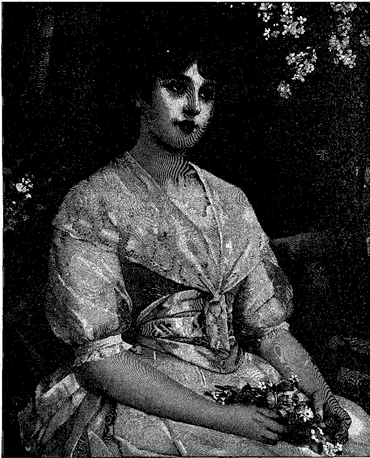
ΑΝΘΗ ΤΗΣ ΝΙΚΑΙΑΣ