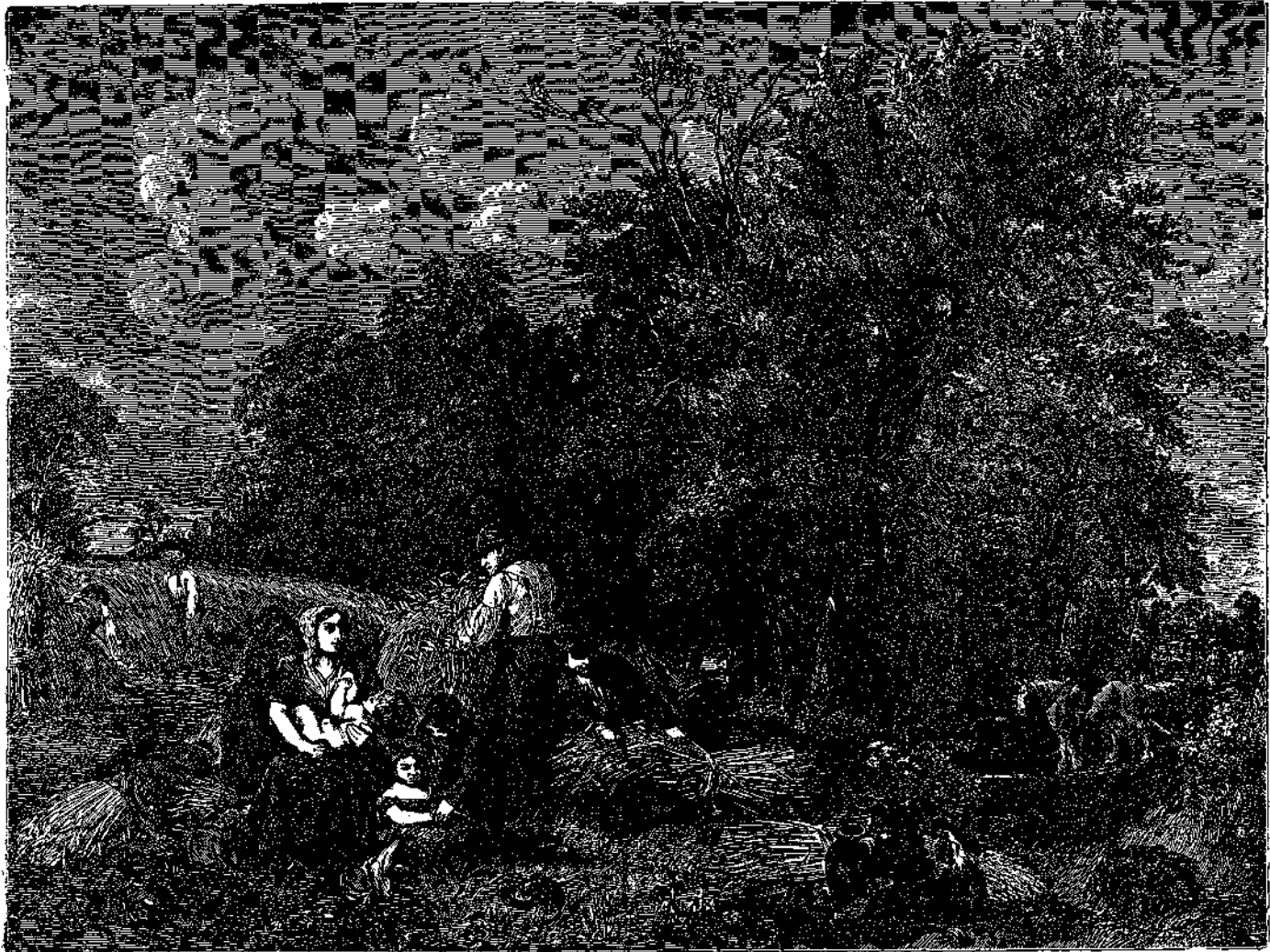
Ο ΘΕΡΙΣΜΟΣ (Εικών)

Ο θερισμός (εικών) υπό Δίκ.— Η μάχη τοῦ Βατερλώ (συνέχεια) υπό Φ. Π.— Ταχυδρομεῖον διὰ περισσερῶν υπό Δ. Σεμ.— Η τεσσαρακοστή (παράδοσις) υπό Ροῦ—Τί ἤθελα νὰ ξέρω (ποίημα) υπό Κ. Α. Δ.— Ο πῖθος τοῦ Διογένηος, υπό Φόσεως.— Ὅρισμοὶ ἐξ ἀνεκδότου συγχρόνου λεξικοῦ, υπό Δίκ.— Ἐκ τοῦ σημειωματαρίου μου, υπό Δίκ.— Εὐτράπελα.— Ἐπιστημονικόν παίγνιον. Ἡ ἀγωνία τοῦ Ταντάλου (μετὰ εικών), υπό Φ. Π.— Αἰνίγματα.— Ἄντα ποηρίσεις.— Ἀγγελίαι.