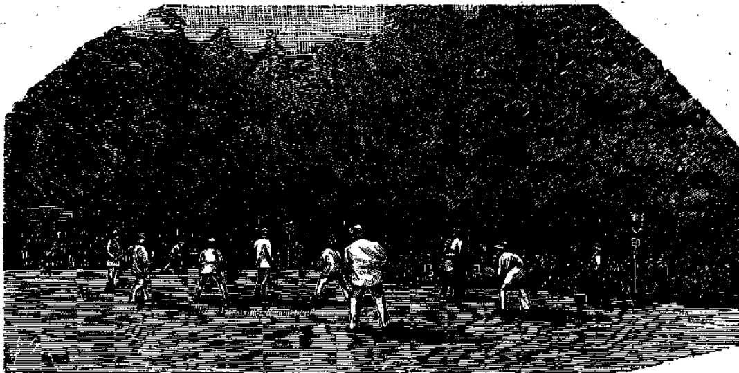
Σφαιροτρα ἐν ἀνοικτῷ ἐδάφει παιζομένη.

« Ἐν ὀνόματι τῆς κυβερνήσεως καὶ τοῦ λαοῦ τῶν Ἠνωμ. Πολιτειῶν, καλῶ διὰ τῆς παρουσίας πάντα τὰ