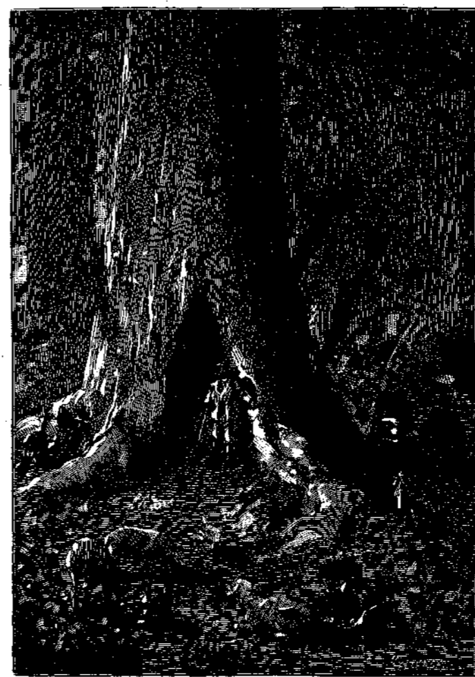
Η ήμερα προαιωνιζετο ευμορφοτάτη.

Περατωθείσης της έκτυπώσεως έν μεταφράσει του Β' έργου του Ιουλίου Βέρν, Ο Σ αν σ ε λ λ ω ρ, ως έν τφ ημετέρφ συγγράμματι άνεφέραμεν, ήρξατο ήδη και προβαίνει εις πέρας η του Γ' έκτύπωσις της Σχολής των Ροβινσώνων, περι ου άποστέρωμεν ν' αναφέρωμεν πλείοτερα, διότι οι ημετεροι άναγνώσται άρκούντως κατενόησαν την σημαντικότητα επείσθησαν περι των έργων του διασημου Γάλλου συγγραφέως. Άρκούμεθα μόνον αναδημοσιεύοντες εναντι δύο [εκ των [εικόνων του έν λόγω έργου της Σχολής των Ροβινσώνων.