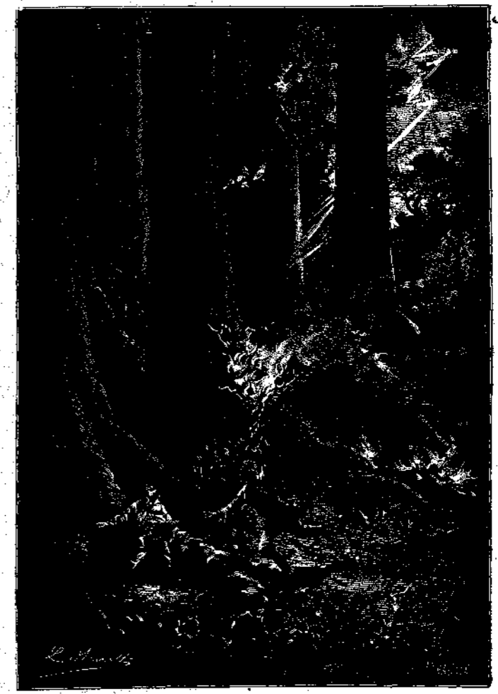
«Φωτιά! φωτιά! — Φωτιά!»