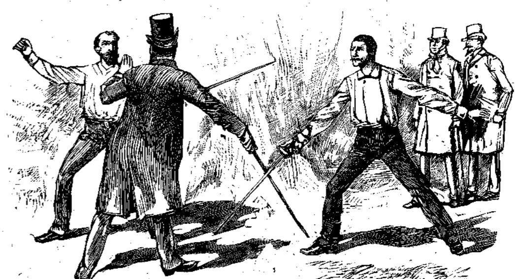
ΕΝ Τῷ ΠΕΔΙῳ ΤΗΣ ΤΙΜΗΣ