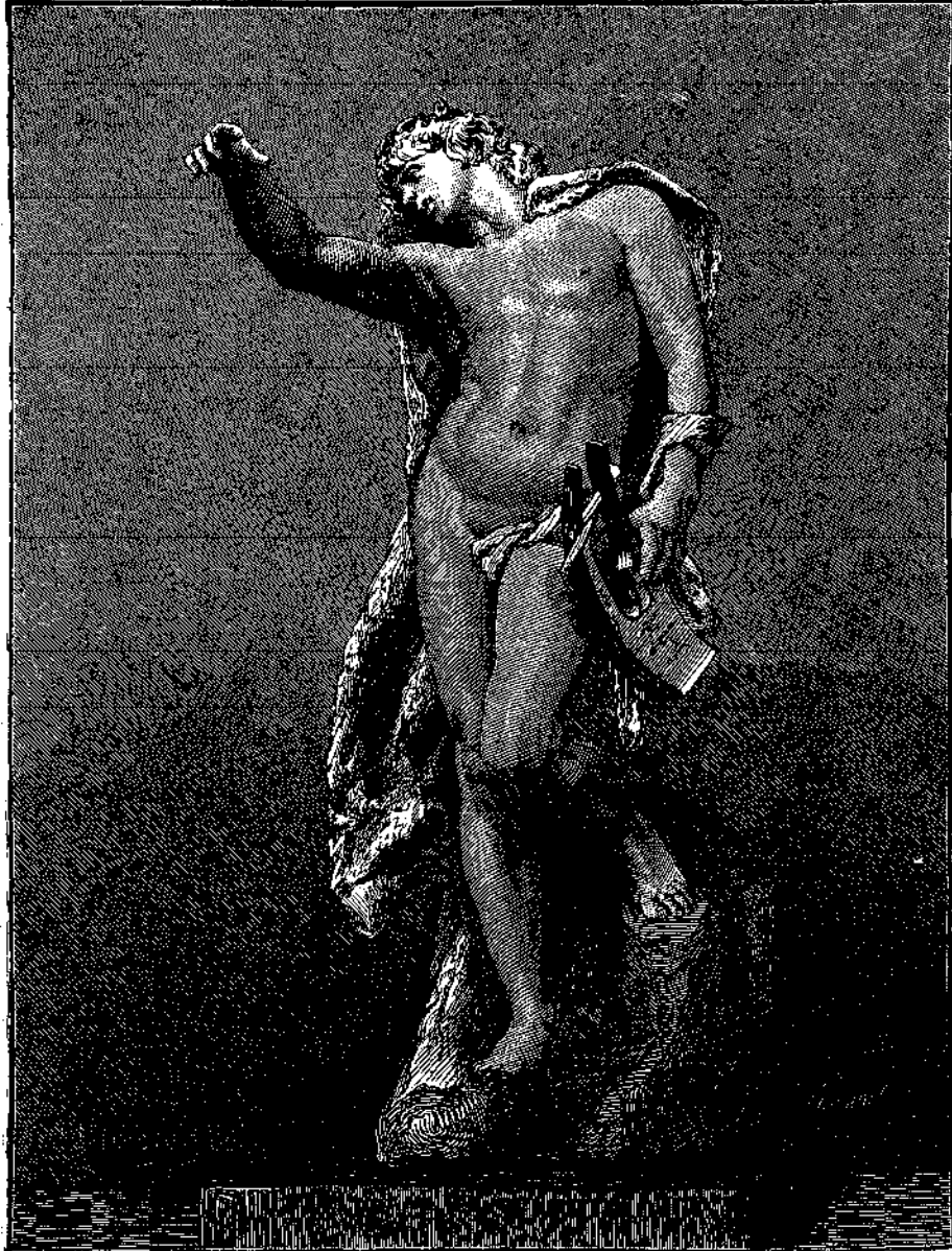
Ο ΟΡΦΕΥΣ ΘΡΗΝΩΝ ΤΗΝ ΕΥΡΥΤΑΙΚΗΝ

Ό αναμένω έτι, δυστυχής του πεπρωμένου ψάλτης, όρφανός, έρημος, άφιλος... Ό! λαλείτε σεις τουλάχιστον τής