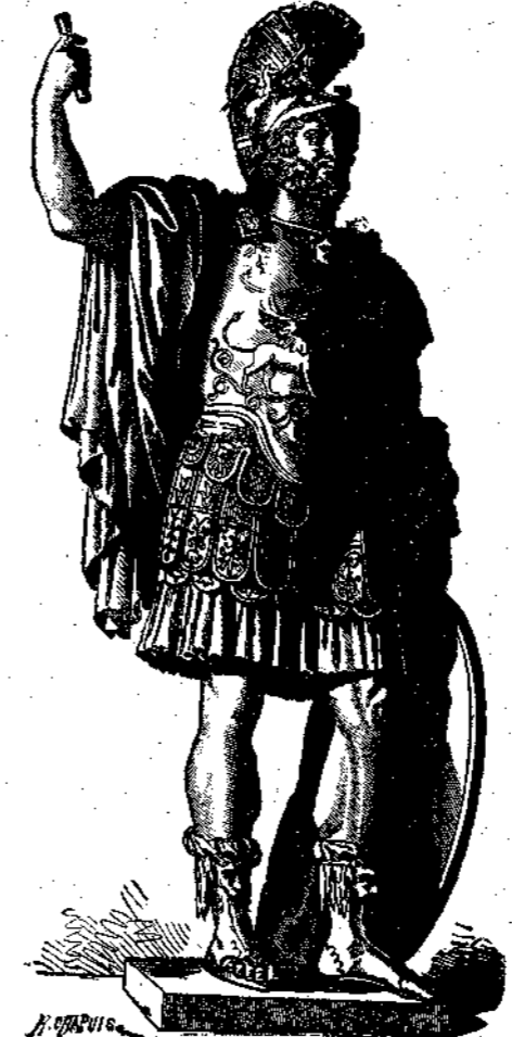
Ο ΗΡΩΣ ΣΘΕΝΕΛΛΑΟΣ

Καὶ ἐκείνη φεῖ! δὲν ἔζη, καὶ δὲν ἦκουε τοὺς θρήνους τοῦ πιστοῦ τῆς ἡμέρας τοῦ, ἀλλ' οὐδὲ καὶ τὴν φωνὴν τοῦ... θελμιμένου ἀδελφοῦ.