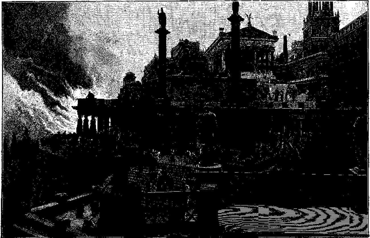
Ο ΕΜΠΡΗΣΜΟΣ ΤΗΣ ΡΩΜΗΣ (καλλιτεχνική ανατύπωση).

ΠΕΡΙΕΧΟΜΕΝΑ. — Η ανακάλυψις τής κιβωτού του Νώε επί του όρους Άραράτ υπό Φ. Π. — Σκέψεις υπό Φρίκ. — Σελίδες εκ τής βίβλου μου, υπό Χ.Η.Α. — Είς τάφος επί του Ταυόγέτου (ειδωλλιακόν άρχαίον διήγημα) υπό Η. — Άνεραστία (ποίημα) υπό Γ. Βοντζαλίδου. — Μικρά άνέκδοτα υπό Ρού. — Σπινθήρες υπό Κυρ-κος — Είναι πεκρά τά ξένα (ποίημα) υπό Γ. Α. Πολίτου. — Έλληνικόν θέατρον. Κάδω ή Αιγερή — Βιβλιογραφικόν δελτίον. — Αινίγματα. — Άλληλογραφία. — Άγγελίαι.