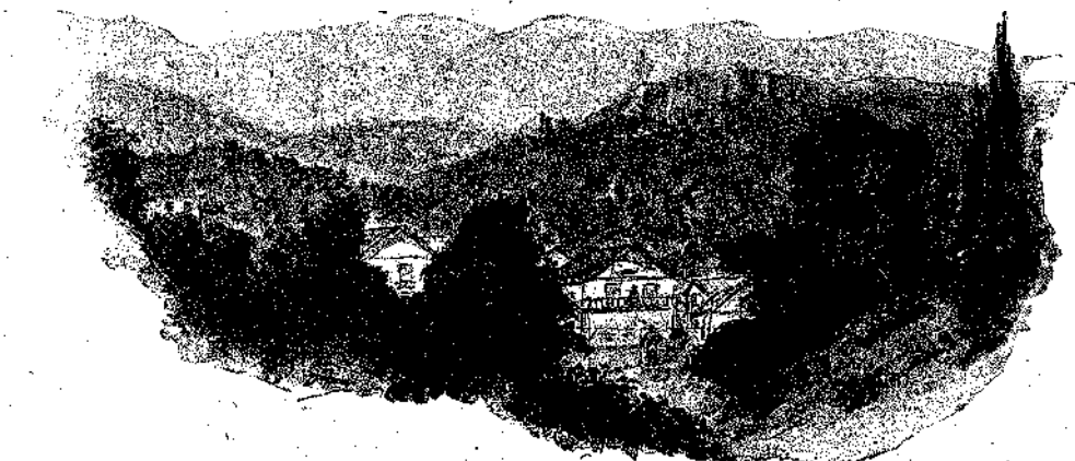
ΤΟ ΧΩΡΙΟ ΤΟΥΣ

Ἐνῷ δὲ συνομιλοῦν ἀκούονται αἰφνης βεβιασμέναι ὕλακαί