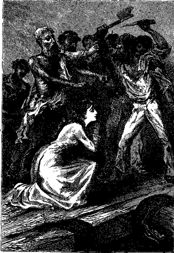
Φίλοι μου! περιμένετε μίαν ἡμέραν.

Ἐκαστός νῦν ἐπανερχεται εἰς τὴν θέσιν του καὶ δι' ὑπολοίπου τινὸς προσπαθείας συνέχει τὰς ἀγγελθόντας του. Οἱ δὲ ναῦται κρύπνεται ὑπὸ τὰ ἱστία, οὐδὲ θέλοντες νὰ ἴδωσι κἀν τὴν θάλασαν. Ὀλίγον τοῖς μέλλει, ἀφ' οὗ θὰ φράξωσιν αὐριον!