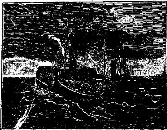
Ἡ πρώτη κατάδυσις καλωδίου.