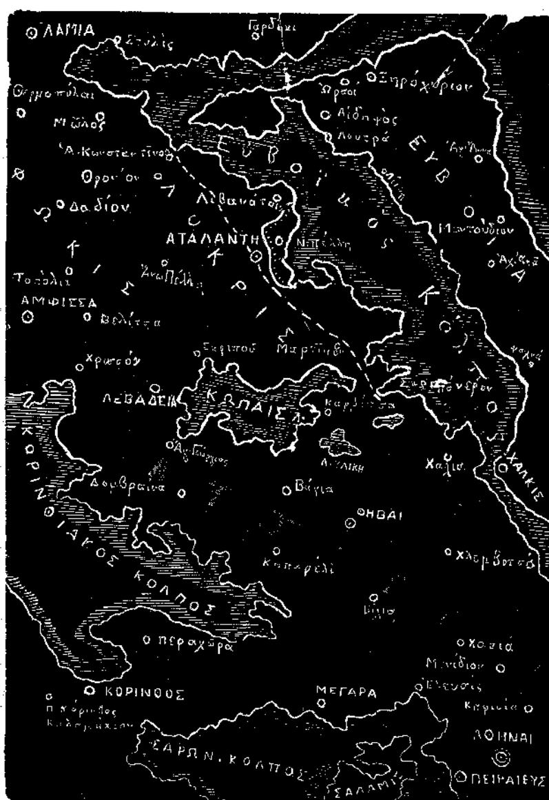
Τοπογραφικὸς χάρτης τῶν προσβληθέντων μερῶν ὑπὸ τῶν σεισμῶν τῆς Λοκρίδος τῆς 8 Ἀπριλίου.

Οἱ σεισμοὶ, ὡς γνωστόν, ὑπάγονται εἰς τρεῖς κατηγορίας εἰς σεισμοὺς ὑφαιστειώδεις, προερχομένους ἢ συνοδευομένους ἀπὸ ἐκρήξεις, συνεπείᾳ συνθλιδομένων ἀερίων καὶ ὑλῶν ὑπὸ τὸ ἔδαφος, ἄτινα συγκλονοῦν αὐτὸ, ἀνερχόμενα βιαίως καὶ ἀποτόμως διὰ κρατήρος ἢ ὀπῶν εἰς τὴν ἐπιφάνειαν τῆς γῆς μετὰ κράτου, καπνοῦ, φλογῶν κ.τ.λ. εἰς σεισμοὺς διολισθήσεως ἢ ἐγκατακρημνίσεως, προερχομένους ἐκ τῆς καταπτώσεως μεγάλων τμημάτων ἰσάφους εἰς σχηματιζόμενας βαθμηδὸν μεγάλας ὑπ' αὐτὸ κοιλότητας, συνεπείᾳ ὀρυκτολογικῶν ἢ ὑδατολογικῶν αἰτιῶν καὶ εἰς σεισμοὺς τεκτονικοῦς, προερχομένους ἐκ στολιδώσεως τῆς γῆς, ἢ μᾶλλον ἐκ τῆς συστολῆς τοῦ φλοιοῦ τῆς γῆς, ὅστις βαθμηδὸν ὡς ἐκ τῆς ἀ-