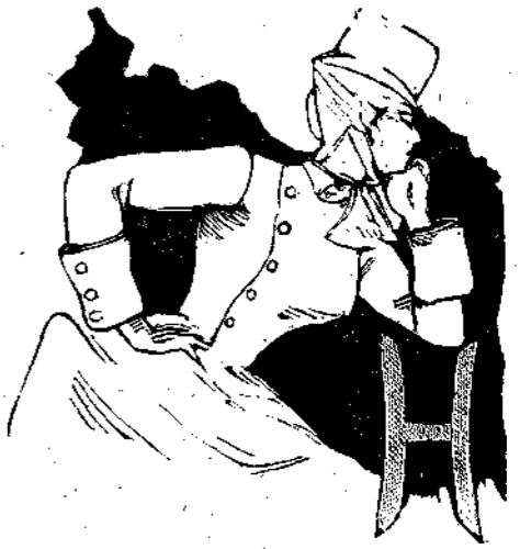
Ἡ Σελήνη διαλογιζομένη τὸν Σάρπ.

Ὁ Σάρπ τότε ἐξήγαγε τοῦ θυλακίου του φαλιδίον περιέ- χον πράσινον ποτὸν και ἔπιεν ὀλίγον. Ἦτο ὑγρὰ τις οὐσία χρησιμεύουσα πρὸς ἀνάληψιν δυνά- μεις και συντήρησιν τῆς ζωῆς. Μετ' ὀλίγον ἀμφότεροι διετέλουν ἄφωνοι και ἀκίνητοι εἰς δύο γωνίας τοῦ διαμερίσματος ἐπιβλέποντες ἀλλήλους. Ἦδη τὸ ψῦχος ἤρχισε να καταλαμβάνῃ τὰ μέλη των και ὁ Σάρπ διελογίσθη να φωνεύσῃ τὸν σύντροφόν του, ὅπως κο- ρέσῃ τὴν πείναν του.