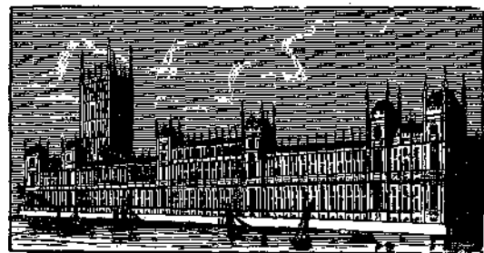
Teatro ducale. Τὸ ἐν Βενετίᾳ περιφημον δουκικὸν ἀνάκτορον μετὰ τοῦ πύργου αὐτοῦ