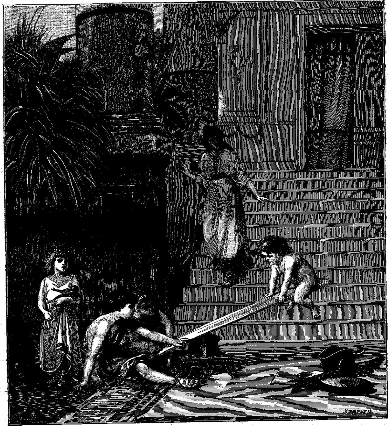
Ἡ παιδικὴ γυμναστικὴ παρὰ τοῖς ἀρχαίοις. La gymnastique des enfants chez les anciens.