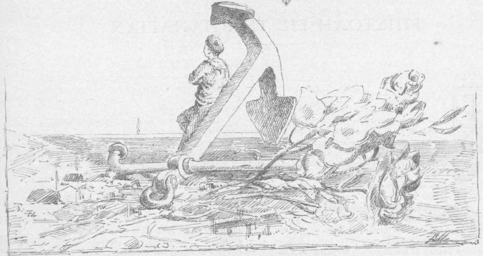
(Σχιόλιασμα Δίμ. Προσαλέντη)

Ὁ χρόνος πάει! Τὸ νέο του τέκνο γράφει Πλῆθος γιὰ σὲ χαρούμενα δελτάρια· Μὲ χρώμα ὠραῖο ταῖς φορεσῆς σου βάζει, Καὶ σοῦ φέρνει σωρὸ μαργαριτάρια.