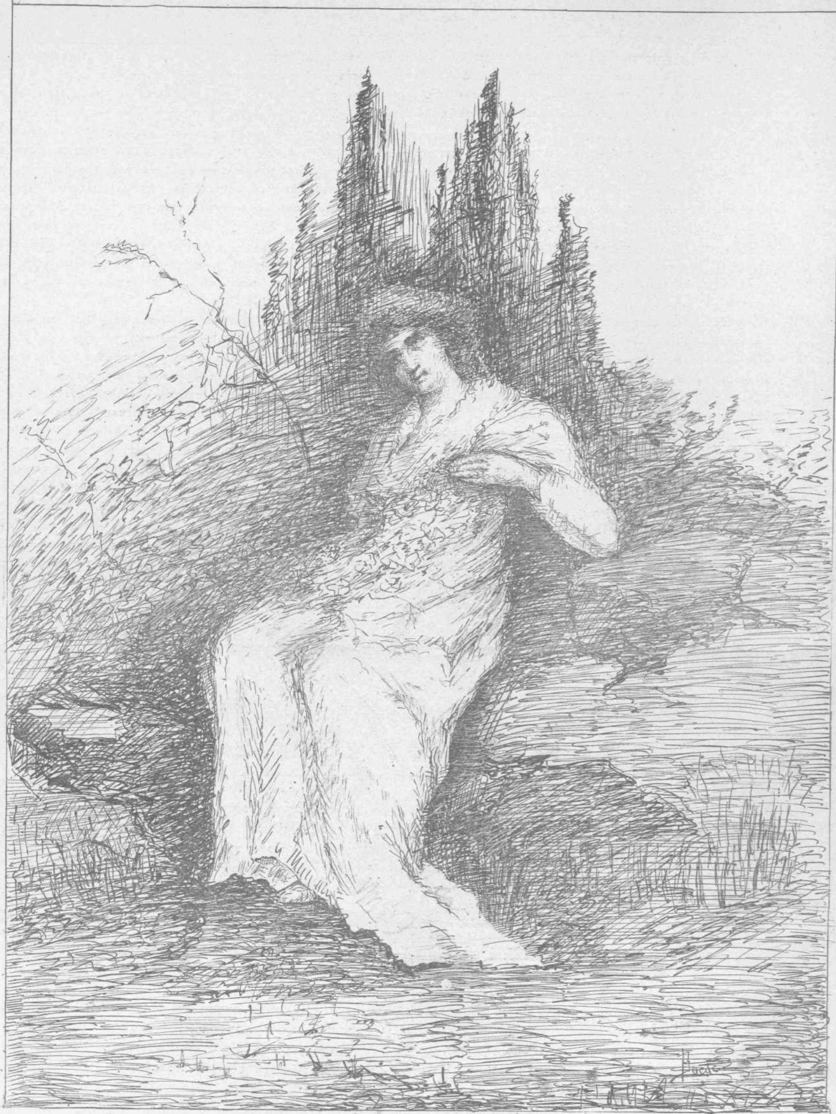
ΕΝ ΩΡΑ ΑΝΟΙΞΕΩΣ (Έργον Β. Μποκατσιάμπη—ἐκ τῆς πινακοθήκης Θ. Βελλιανίτου)