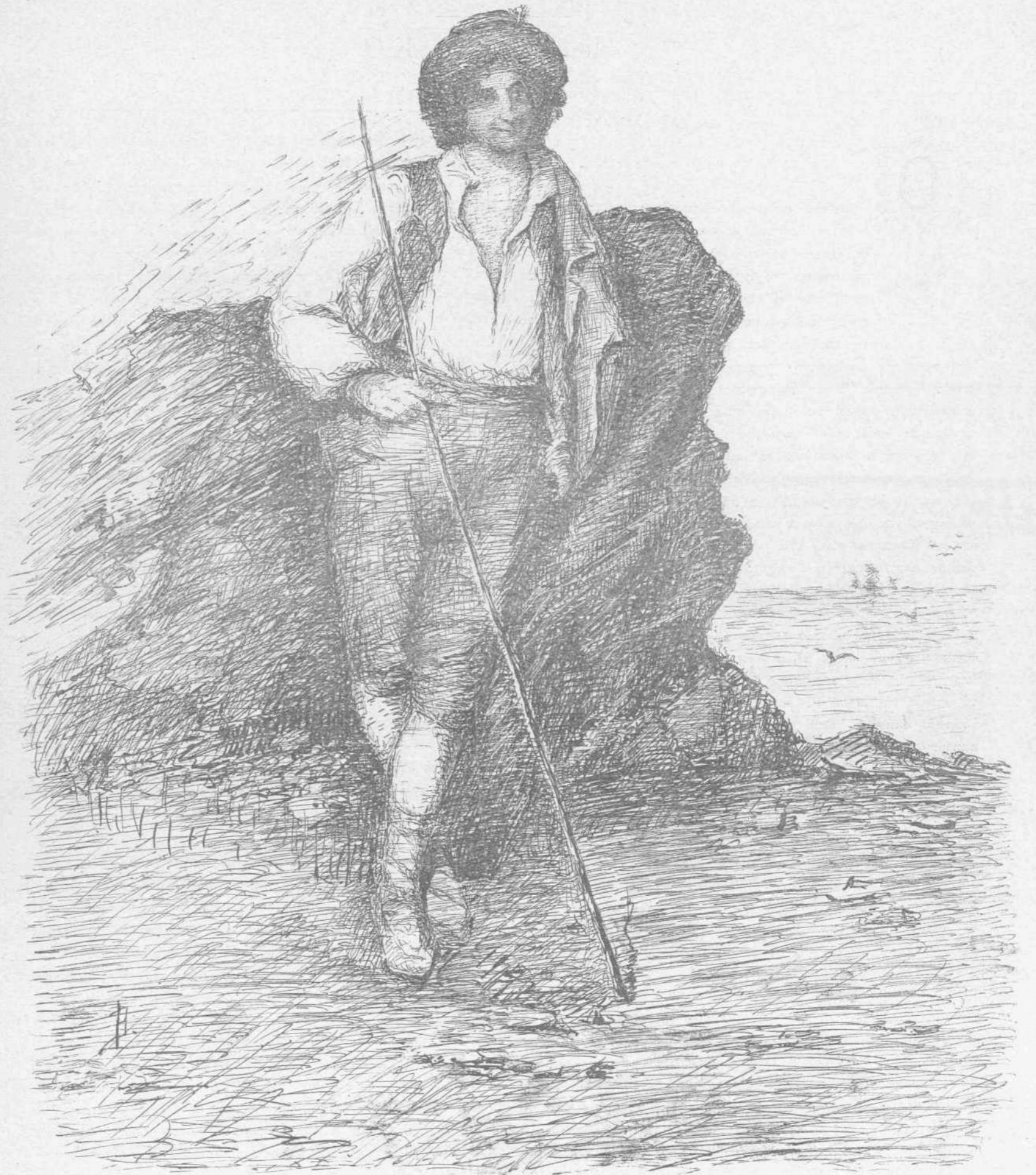
ΡΩΜΑΙΟΣ ΒΟΣΚΟΣ (Έργον Β. Μποκατσιάμπη—ἐκ τῆς πινακοθήκης Θ. Βελλιανίτου)