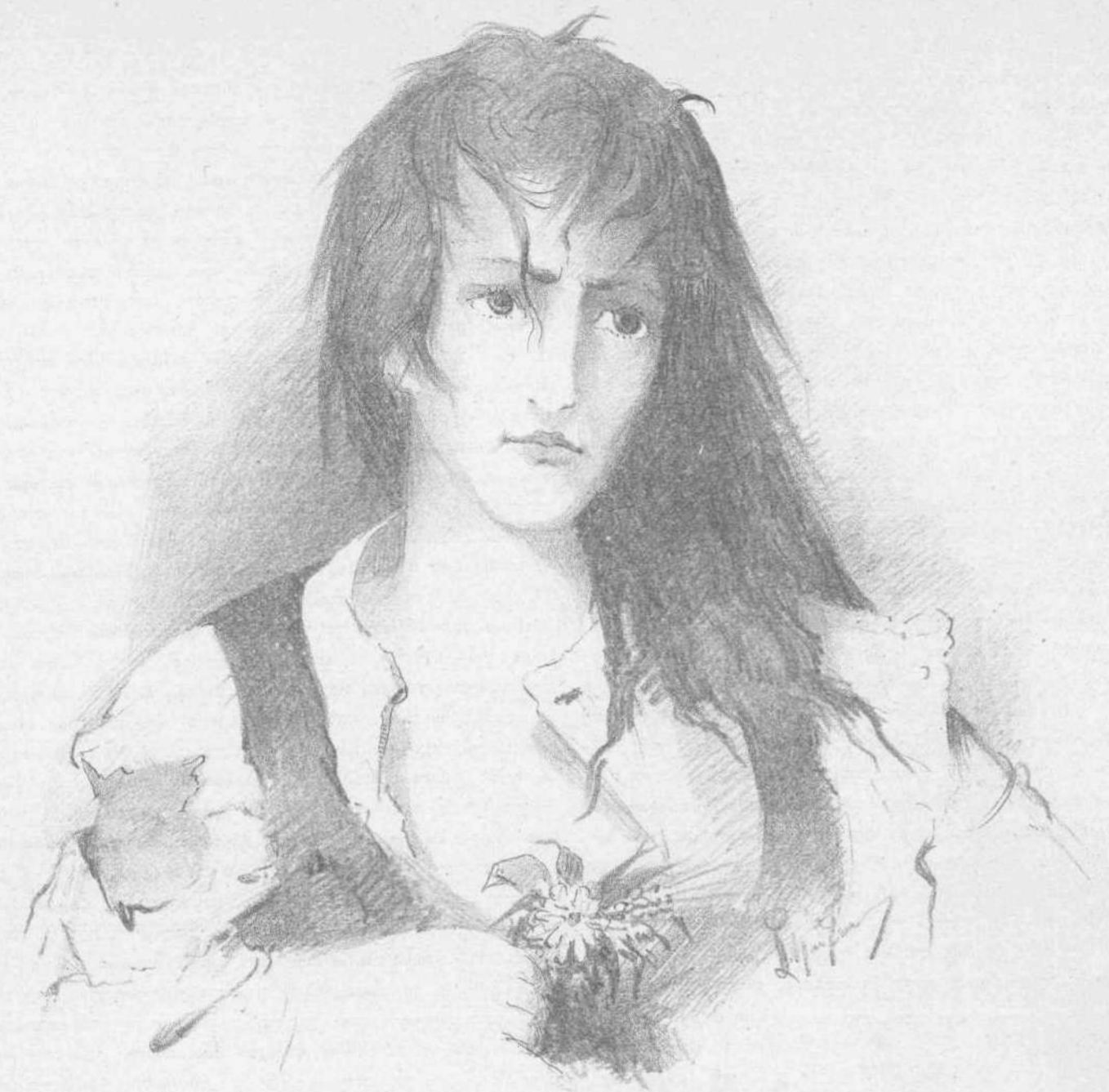
Η ΤΡΕΛΛΗ (Σχεδιασμά Σ. Μαντζάκου)