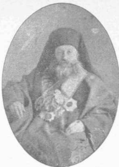
ΓΡΗΓΟΡΙΟΣ Ο ΣΤ'.

Ὁ Λεωνίδας οὗτος τῆς Μ. Ἐκκλησίας ἦτον Ἡπειρώτης, Μολοττός, ἐκ τῆς μεγάλης καὶ πολυκρίθμου οἰκογενείας τῶν Ζώτων, ἧτις εὐρίσκειται διαμοιρασμένη εἰς 43 τεσσαράκοντα τρεῖς πόλεις τῆς Εὐρώπης καὶ Ἀσίας, ὡς ἐπὶ τὸ πλεῖστον δὲ ἀπὸ τοῦ τυράννου τῆς Ἡπείρου Ἀλῆ Τεπελενλή, ἦτον εἰς τὸν θρόνον τοῦ Χρυσοστόμου τὸ 1873. Ἄξιον ἱστορικῆς ἀνμνήσεως εἶνε, ὅτι ὅτε ἐζήτησε Σύνοδον οἰκουμενικὴν, διὰ τὸ σχίσμα τῶν Βουλγάρων, καὶ παρητήθη διὰ γνωστοὺς λόγους, ἐγραψε πρὸς τὸν Ὑπουργὸν τῶν Ἐκκλησιαστικῶν τῆς Ῥωσσίας τὴν τολμηρὰν ἀπάντησιν, ὅτι δὲν σῆς ἐρωτῶμεν πόσοι εἰσθε σεῖς οἱ πολλοὶ, οὐς θέλωμεν ἀποσχίσει ἡμεῖς οἱ ὀλίγοι, ἀλλοῦ ποῦ εἰπθε, ποῦ εὐρίσκεσθε; βυδίζετε πρὸς τὴν αἵρεσιν τοῦ ἐθνοφυλετισμοῦ καὶ ἀποσχίζεσθε ἀπὸ τὴν ὀλομέλειαν τῆς Ὁρθοδοξίας, μόνοι σας, ἡμεῖς ὅμως εὐχόμεθα «ὑπὲρ τῆς τῶν πάντων ἐνώσεως». Γρηγόριος ὁ Σ'.