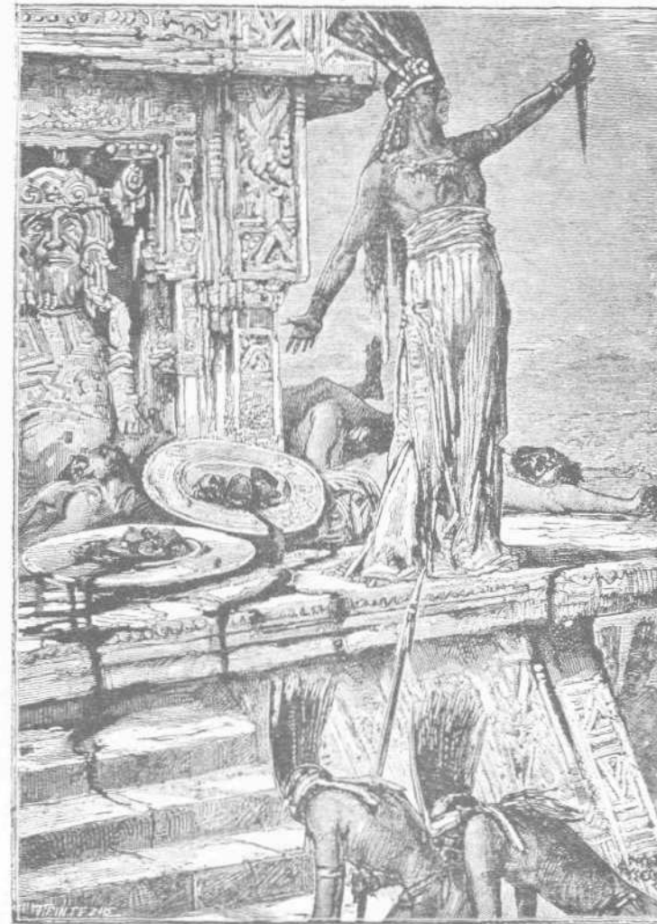
Ὁ Μεξικανὸς ἱερεὺς ἐφάνη κρατῶν τὴν αἰμοδαγῆ μάχισσαν.

Μόλις λοιπὸν ἔμαθε διὰ τῶν κατακτόπων του τὰ σχέδια τοῦ Κορτέζ ἠτοιμάσθη νὰ τὸν ἀποκρούσῃ σθεναρῶς.