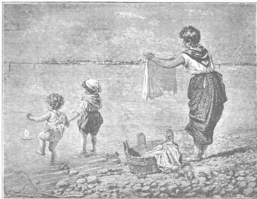
Παρά τὸν αἰγιαλόν.