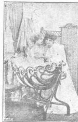
Ἡ Νιόβη ἐξηκολούθει νὰ εἶναι μητὴρ πάντοτε . . .

— Τὴν ἐγνώρισαν μόλις εἶχον ἀρχίσει τὰ μαθήματα αἰ δὲ διασκαδάσεις ἐξηκολούθησαν διηγετικῶς ὅτε ἐπῆλθεν ὁ χειμὼν. Εἰς τὰς Ἀθῆνας ὁ χειμὼν εἶνε πολὺ εὐχάριστος, διότι κατὰ τὰς μακρὰς νύκτας παντοῦ διασκαδάζουν.