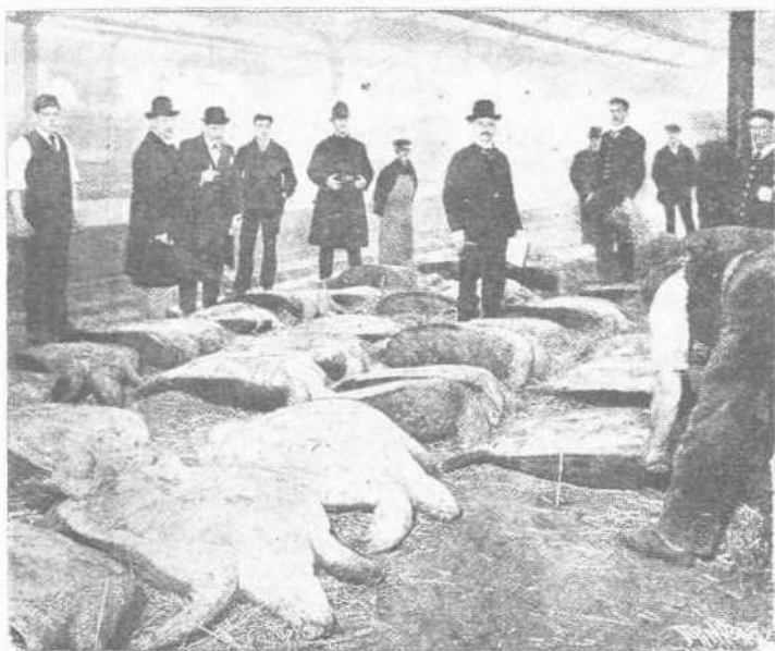
Χελώναι εν σιδηροδρομικῷ σταθμῷ ἔτοιμοι πρὸς ἀποστολὴν.

Ὅσάκις τις εὐρεθῆ πρὸ πινακίου ἐκ τῶν λεπτοφυῶν τὴν ὄρεξιν χελωνοφάγων Εὐρωπαϊῶν σούπας ἐκ χελώνης, αἰσθάνεται σποδρῶς διεγειρομένης τὰς λουκουλείους ὀρμὰς του, ἀλλ' ἐλάχιστα ἴσως γνωρίζει πόσον δυσκόλως παρασκευάζεται τὸ γαργαλιστικὸν τοῦτο φαγητόν. Ἐκ τῶν ἐδωδίων χελωνῶν εἶναι ἰδιαιτέρως ἀγαπητὰ τρία εἶδη: αἱ ἀλλιγοροειδεῖς 1 καὶ αἱ πράσιναι χελῶναι. Ὡς δὲ ὁ ἀγγλος συγγραφεὺς H. Shepstone εἰς περισπούδαστον ἔργον περὶ τῶν τριῶν τούτων γενῶν τῶν χελωνῶν ἀναφέρει, ἡ μικροτέρα τούτων ἡ τερρασινή λεγομένη χελώνη ἤτο ἀρκετὰ πολυάριθμος εἰς τὴν Β. Ἀνατολικὴν ἀκτὴν τῶν Ἠνωμένων Πολιτειῶν, ἀπὸ τῆς Μασσαχουσέτης μέχρι τοῦ Τεξάς, ἀλλ' ἐν βραχείῳ χρονικῷ διαστήματι σχεδὸν παντελῶς ἐξήρανήθη. Ἐπειδὴ ὅμως τὸ κρέας τῆς ἐζητεῖτο πανταχόθεν ὡς ἐξαιρετικόν τι, ἐσκέφθησαν ἐπιχειρηματίαι τινες νὰ ἀναθρέψωσι ταύτην τεχνητῶς. Οἱ καλλιερῆται, οὕτως εἶπεν, τῶν χελωνῶν τούτων κτεσκεύαζον λίμνας πλησίον τῶν ἀκτῶν, εἰς ἃς εἶχεν εἰσοδὸν τὸ θαλάσιον ὕδωρ, καὶ ἐν αὐταῖς ἄφρον τὰ ζῶα ταῦτα νὰ ἐναποθέτωσι κατὰ βούλησιν τὰ ὡὰ των καὶ νὰ πολλαπλασιάζωνται. Ὡς ἐκ τούτου ἡ καλλιέργεια τῶν χελωνῶν τούτων ἀπέβη ἀρκετὰ προσοδοφόρος ἐργασία, τοῦ κρέατος των κατὰ προτίμησιν χρησιμοποιουμένου πρὸς κατασκευὴν σούπας καὶ ἄλλων φαγητῶν.