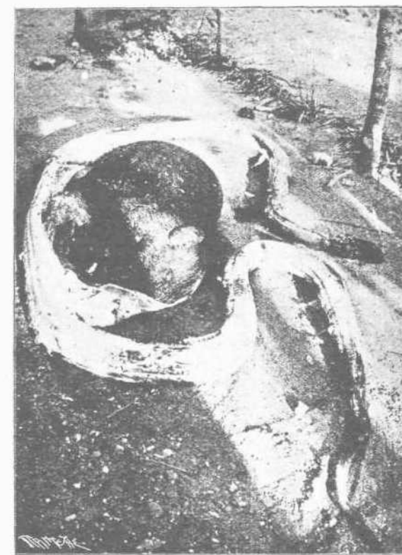
Ἐνοίγησεν τότε τῆς κοιλίας τοῦ Πύθωνος, εὐρέθη ὁ καταποθείς ἀγριοχοῖρος ὅλος ἀκέραιος.

στενωτέρου ὄφeos κατεπόθη. Τὴν αὐτὴν ὁμως ἐκπληξίν διὰ τὴν δυσαναλογίαν εὐρίσκομεν ἐπίσης εἰς ἄλλα ἔρπετα μεταξὺ τούτων καὶ τῶν ὑπ' αὐτῶν καταβροχθιζομένων θηραμάτων. Ἡ ἐξήγησις διὰ τὸ δυνατόν τῆς καταπόσεως ἐγκεῖται εἰς τὴν μεγάλην ἐλαστικότητα τῶν συνδέσμων τῶν σιαγόνων. Ἐν ᾧ δύναται τὸ κρανίον πολὺ εὐρέως πρὸς τὰ ἄνω νὰ ἀνοιχθῆ, ἢ κάτω σιαγῶν ἐπίσης δύναται ν' ἀνοίξῃ πρὸς τὰ κάτω.