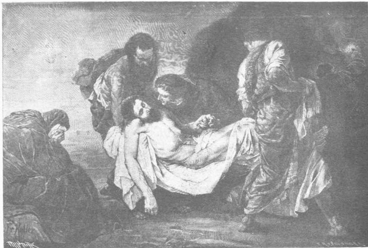
“ΚΑΘΕΛΩΝ ΑΠΟ ΤΟΥ ΞΥΛΟΥ Ο ΙΗΣΟΥΣ ΕΝ ΜΝΗΜΕΙΩ ΚΑΙΝΩ ΑΠΕΘΕΤΟ,,

γεῦμα εξέλεξαν. Τὸ δηλητήριον ῥέει, ὡς πάντες καλῶς γνωρίζομεν ἐκ τοῦ δηλητηριώδους ὀδόντος διὰ τινος σωλήνος εἰς τὸ τραῦμα. Καὶ ἡσυχον δύναται τὸ ἔρπετον νὰ περιμένῃ, ἕως ὅτου τὸ δηχθὲν ζῶον ἀποθάνῃ.