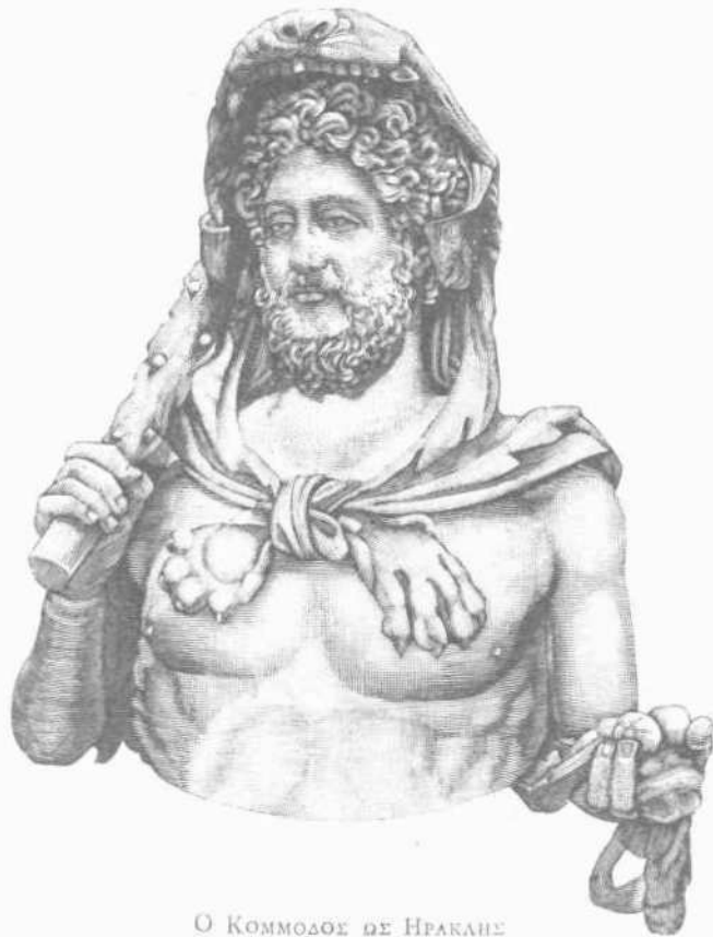
Ο ΚΟΜΜΟΔΟΣ ΩΣ ΗΡΑΚΛΗΣ

ἀθόφους πολλοὺς συλλήβδην. Ὅπως δειξῆ δὲ ποτε οὕτω τρόπῳ ὁ Ἡρακλῆς ἐτόξευσε τὰς Στυμφαλίδας, ἐσκόπει ἵνα εἰς τὸ πυκνὸν τοῦ θεάτρου πληθῆς ὡς εἰς ὄρνιθας τοξεύσῃ· ἀλλ' ὁ σκοπὸς ἐματαιώθη, διότι ὁ λαὸς προμαθὼν αὐτοῦ τὸ βούλευμα οὐδὲ παρέστη ἐν τῷ θεάτρῳ, ἄλλως τε καὶ ἀναμιμνησκόμενοι ὅτι ἄλλοτε ποτε πρὸς μίμησιν γιγαντομαχίας τινὸς ἢ δρακοντομαχίας συναθροίσας πάντας τοὺς ἐν τῇ Ῥώμῃ ὑπὸ νόσου ἢ ὑπ' ἐτέρως τινὸς συμφορᾶς ἐστερημένους τῶν ποδῶν περὶ τὰ γόνατα αὐτῶν περιέπλεξεν