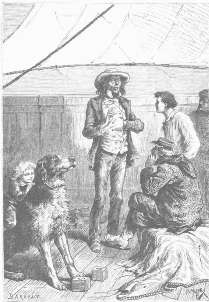
Δὲν πρέπει νὰ πιστεύητε ὅτι οἱ κύνες μόνον ἔχουσι τὸ δικαίωμα νὰ εἶνε εὐφυεῖς

κατάπλου μεταξὺ Αὐστραλίας καὶ Ἀμερικῆς. Διὰ τὸν μετὰ προσοχῆς παρατηρούμεν ἡ μόνοντος καὶ ἡρέμης θάλασσα φαίνεται παμπόκιλος. Αἱ ἀνεπαίσθητοι μεταβολαὶ γοητεύουσι τὴν φαντασίαν ἢ ὅποια ἐννοεῖ τὴν ποιήσιν τοῦ Ὀκεανοῦ. Χόρτον θαλασσινόν τὸ ὅποιον ὑποπλεῖ κυματιζόμενον, εἰς κλάδος τοῦ ὁποίου ἡ ἐλαφρὰ γραμμὴ διασχίζει τὴν ἐπιφανείαν τῶν κυμάτων, ἐν πεμάχιον σπινίδος τοῦ ὁποίου ζητοῦμεν νὰ μαντεύσωμεν τὴν ἱστορίαν, ταῦτα ἀκοῦσι πάντα ὅπως τέρψωσι τὴν φαντασίαν μας, ἀπέναντι δὲ τοῦ ἀχανοῦς τοῦ πνεύμα δὲν ἵσταται διόλου, ἡ φαντασία ἔχει ἐλεύθερον σταθίον διότι ἐκαστον μῦθον ὕδατος ἐξαπμιζόμενον μεταξὺ τῆς θαλάσσης καὶ τοῦ οὐρανοῦ περιέχει ἴσως τὸ μυστικὸν καταστροφῆς τινος. Ἡ ζωὴ ἄλλως ἐκδηλοῦται καὶ ὑπὸ τὰ ὕδατα αὐτά. Οἱ ἐπιβάται τοῦ Πιλιγκρίν διέκρινον ἰσχυρὰ μικροῦς καταδύοντες ὑπὸ σμήνην πτηνῶν, τὰ ὁποῖα κατήλθον ἐκ τῶν πύλων φεύγοντα καὶ ταῦτα τὸ ὄραμα τοῦ χειμῶνος ψυχῆς. Πολλὰκις ὁ Ντίγκ-Σάντ, μαθητῆς τοῦ Ἰακώβου Γουλιέλμου Βελντόν, εἶδει θεαυμασίαν ἐπιτηδεύοντα εἰς