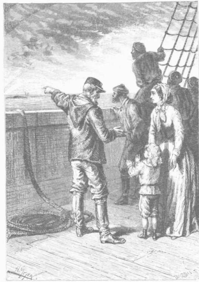
«Α! θέλεις νὰ ἔχῃς αὐτὴν τὴν φαλαίνα παιδί μου!»

— Πράγματι, Ντίκ, ἀπήντησεν ὁ πλοίαρχος. Δὲν εἶναι ἀμφιβολία, εἶναι φαλαίνα μακροπτερυγία ἥτις