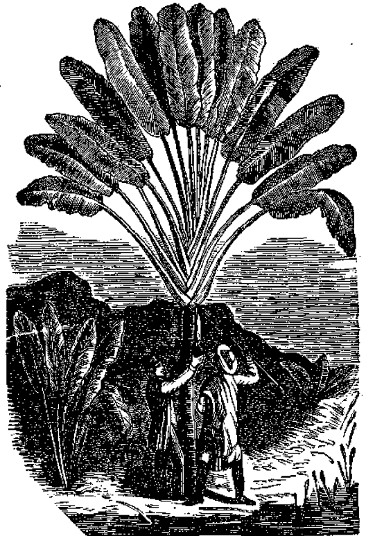
ΤΟ ΔΕΝΔΡΟΝ ΤΩΝ ΟΥΡΑΝΙΩΝ (Urania speciosa)

Εἰς τὴν Ἀμερικὴν ὑπάρχουν τὰ πλουσιώτατα μεταλλεῖα τοῦ σιδήρου εἶναι δὲ περιεργον, ὅτι ὁ Θεὸς ἔθεσε τὸν σιδήρον καὶ τοὺς λιθάνθρακας πλησίον ἀλλήλων, ὥστε νὰ εὐκολύνωνται οἱ ἄνθρωποι εἰς τὴν ἀποχώρισιν τοῦ σιδήρου, ὅστις εἶναι ἀναγκασιότατος εἰς τὰς χρεῖας τοῦ ἀθρώπου.