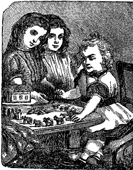
Η ΚΙΒΩΤΟΣ ΤΟΥ ΝΩΕ.