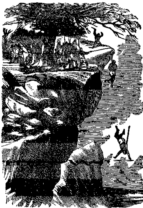
ΟΙ ΜΑΡΤΥΡΕΣ ΤΗΣ ΜΑΔΑΓΑΣΚΑΡ.

χεται εἰς ἐπαρῆν — ἀνευ τῆς ἰδιότητος ταύτης δὲν θὰ ἤμποροῦμεν νὰ μεταχειρισθῶμεν τὴν μελάνην, μὲ τὴν ὁποίαν γράφομεν, διότι δὲν θὰ ἔστεκεν εἰς τὸ κονδύλι — δὲν θὰ ἠδυνάμεθα νὰ πλύνωμεν τὰς χεῖρας καὶ τὸ πρόσωπον, καὶ νὰ καθαρίζωμεν τὰ φορέματά μας. Δὲν ἠδυνάμεθα νὰ κατασκευάζωμεν ἄρτον, διότι τὰ μόρια τοῦ ἀλεύρου δὲν θὰ ἠδύνατο νὰ ἐνωθῶσι διὰ τοῦ ὕδατος, οὐδὲ νὰ μαγειρευθῶμεν φαγητά. Πῶσον εὐγνώμονες λοιπὸν πρέπει νὰ ἦμεθα εἰς τὸν Οὐράνιον ἕμῶν Πατέρα διὰ τὴν σοφὴν καὶ ἀγαθὴν ταύτην πρόνοιαν, τὴν ὁποίαν ἔλαβε προικίσας χάριν ἡμῶν τὸ ἀπαραίτητος ἀναγκαῖον τοῦτο πρᾶγμα διὰ τὴν ζωὴν καὶ τὴν υγιείαν τοῦ ἀνθρώπου μὲ τοιαύτην θαυμαστὴν ἰδιότητα!