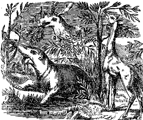
Μεγάθηρ, Σιδάθηρ, Καμηλοπάρδαλις.