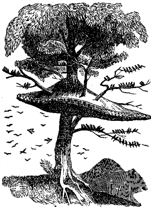
Αἱ Φωλαὶ τοῦ Δημοκράτου.

Ταῦτα καὶ τὰ τοιαῦτα συχνάκις μελετῶντες, θέλομεν πληροφρηθῆ, ὅτι δὲν ὑπάρχει τίποτε τῆς ταπεινοφροσύνης λογικώτερον, οὐδὲ τῆς ὑπερηφανίας ἀνοητώτερον.