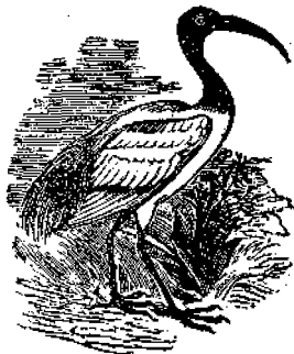
ΙΒΙΣ Ο ΙΕΡΟΣ.

Ἔχει και ἄλλας ιδιότητες τὸ ὕδωρ, τὰς ὁποίας οἱ μικροὶ μας ἀναγνώσται θὰ μάθωσιν, εἴταν σπουδάσωσι περισσότερο. Ἐν τούτοις ἔχομεν χρέος νὰ εὐγνωμονῶμεν τὸν Θεὸν διότι ἔκαμε τὸ ὕδωρ και τὸ ἐπρόικισε μὲ τοιαύτας ιδιότητας.