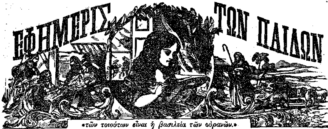
«τῶν τοιούτων εἶναι ἡ βασιλεία τῶν οὐρανῶν.»