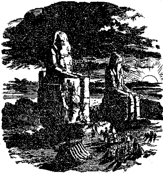
Ἀρχαῖα ἀγάλματα ἐν Ἀθῆναις.

Ἄν και ἐλησμώνησαν οἱ ἄνθρωποι τὸν Θεόν, ὅμως δὲν ἤρχοντο, δὲν ἦσαν εὐχαριστημένοι νὰ ζῶσι χωρὶς Θεοῦ, συγχωθάνοντο οὐ ἐγχειρίζοντο τινα προστάτην και φίλον. Ὁνοῦς των ἦτο τόσον ἐσκατισμένος ὡς δὲν ἠδύναντο νὰ ἐνοήσωσι Θεὸν ἀόρατον, βλέποντες δὲ τὸν ἥλιον, τὴν σελήνην και τοὺς ἀστέρας λάμποντας ὑπὲρ τὰς κεφαλὰς αὐτῶν και ἀισθανόμενοι τὴν χρησιμότητά των ἤρχισαν νὰ τοὺς τιμῶσιν ὡς Θεοὺς.