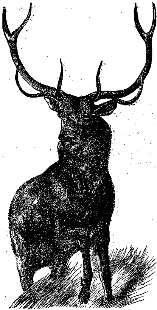
Η ΕΛΑΦΟΣ ΤΗΣ ΒΟΡΕΙΟΥ ΑΜΕΡΙΚΗΣ.

«'Ενώπιον της πολιαs θέλεις προσηκώνεσθαι, και θέλεις τιμήσαι το πρόσωπον τοϋ γέροντος, και θέλεις φοβηθῆ τον Θεόν σου. 'Εγώ ειμαι ο Κύριος — (Λευιτικόν 16, 32.)