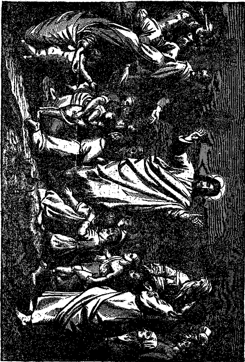
ΠΑΙΔΙΑ ΕΠΙΔΕΙΧΝΟΜΕΝΑ ΠΡΟΣ ΤΟΝ ΚΥΡΙΟΝ ΙΗΣΟΥ ΧΡΙΣΤΟΝ.

πολύχρον πενήχρον ἐκ τεσσαράκοντα οίκων, 'Ραχάβ καλούμενον· τὰ δὲ κτήρια, τὰ ἑποῖα φαίνονται εἰς τὴν εἰκονογραφίαν μας, εἶναι ἐρεῖκια πόργου, ἢ προμα- χῶνος ἀνεγερθέντος πρὸς ὑπερμάχιον τῆς πόλεως. Οἱ κάτοικοι τῆς οὔν 'Ιεριχῶ νομίζουσι, ὅτι ταῦτα ἦσαν ἡ οἰκία τοῦ Ζακχαίου! θεωροῦσι δὲ καὶ τὸν ἕνα ἐκ τῶν δύο φοινίκων ὡς τὴν μωρέαν, ἐπὶ τῆς ὁποίας ἀντὶς ἀμψὴ διὰ νὰ ἴσῃ τὸν Χριστὸν διαβαίνοντα!!