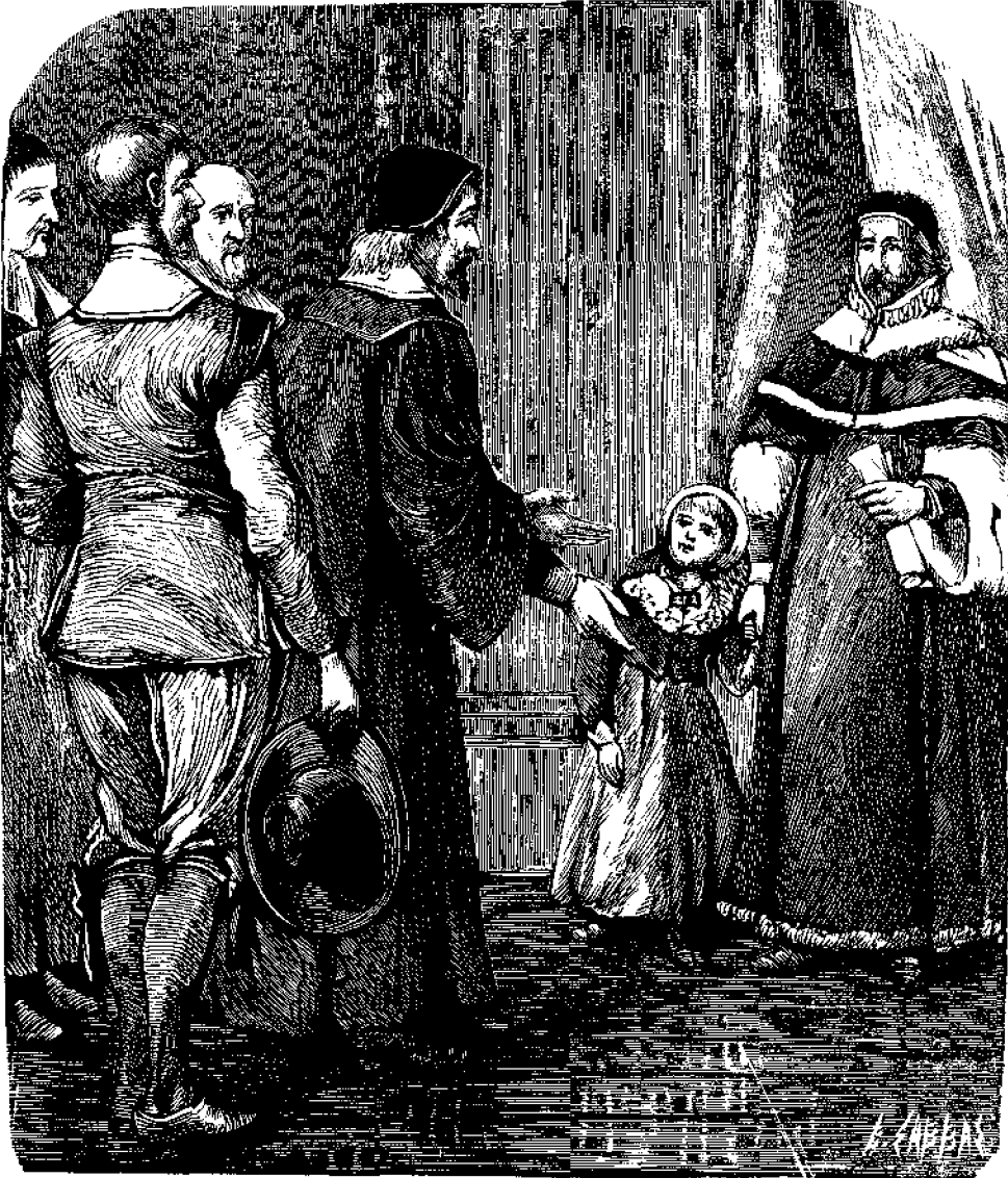
·Η εὐχὴ τοῦ καλοῦ ἱεροκλήρουκος.

τοῦ ἡλίου εἶναι ἀρκετὸν, ἀλλ' ὅταν κατέρχεται εἰς μεγάλη βλάβη, λαμβάνει φανὸν ἠλεκτρικὸν, ὅστις τῷ δίδει ἄπλετον φῶς. Ἄλλοτε οἱ δῦται συνενοῦντο μὲ τὸν ἄνω διὰ μέσου σχοινίου, τὸ ὅποιον ἔσωρον ἅπαξ μὲν. ὅταν ἤθελον περισσώτερον ἀέρα, τρίς ὅταν ἐσήμερινον ἀνάβασιν, κτλ. Τοῦτο ὁμοῦς ἀντικατέστησε