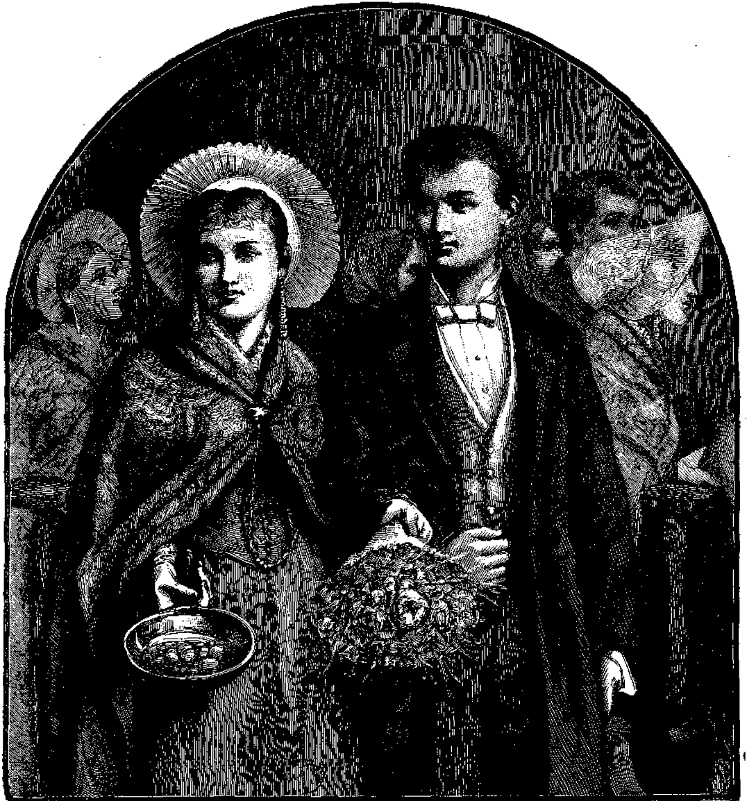
Ἐλεημοσύνας διδόμεναι κατὰ τὴν τελετὴν τῶν γάμων.

δήποτε θεῖον ἢ θεῖα Πρόνοια ἤθελε θέσει αὐτόν. Ἡ εὐγνωμοσύνη μιᾶς οἰκογενείας, μιᾶς ψυχῆς, λυτρωθείσης ἀπὸ τῆς δουλείας τῆς ἀμαρτίας, ἀξίζει περισσότερον τοῦ θαυμασμοῦ καὶ τῶν ἐπαίνων, τῶν ἀποδιδωμένων εἰς τοὺς δορυκτῆτορας τοῦ κόσμου, θὰ διαρκῆ δὲ αἰωνίως, ἐνῶ ταῦτα μετ' οὐ πολὺ θὰ παρέλθουν καὶ λησμονηθῶν.