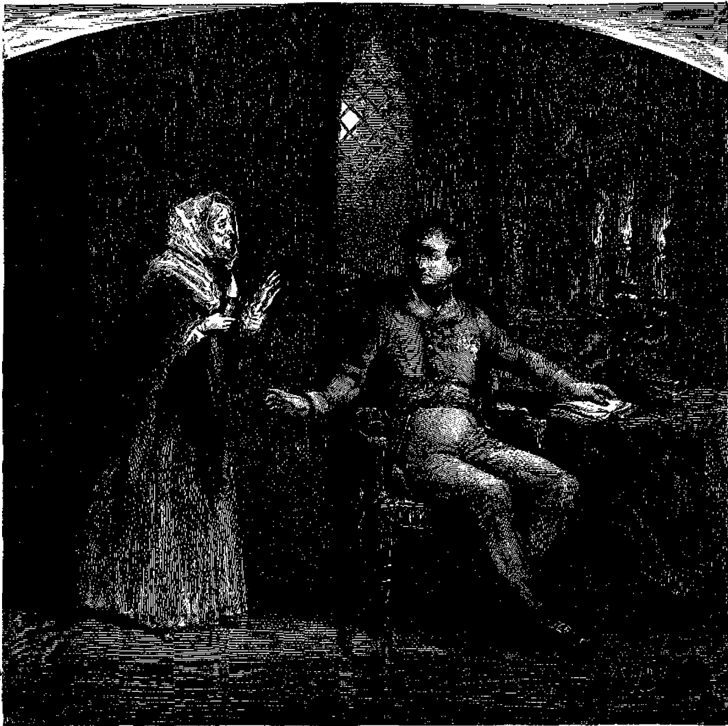
Ὁ Αὐτοκράτωρ Ἀλέξανδρος καὶ ἡ κυρία δὲ Κρούδενερ.

φαράδων, οἵτινες εὐρίσκονται καθ' ὅλην τὴν Μεσό- γειον καὶ Ὀκεάνειον παραλίαν τῆς Γαλλίας, εὐ- φραίνει δὲ καὶ τοὺς νεοσύμφους, διότι συλλογίζονται, ὅτι πολλαὶ δεήσεις ἀναπέμπονται ὑπὲρ αὐτῶν εἰς τὸν Ὑψιστον.