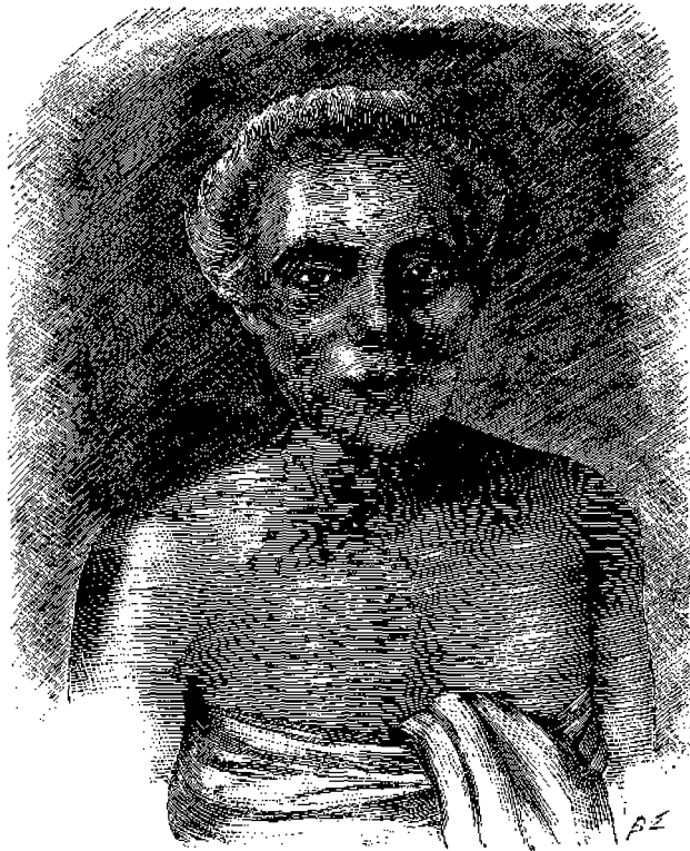
Σαμοανὸς ἀρχηγὸς ἐκχριστιανισθεῖς.

φέρονται περὶ διαφορῶν προσώπων ἐν τῇ ἱστορίᾳ. Πάντα ταῦτα ὁμῶς ὑπερβαίνει τὸ ἀναφερόμενον ὑπὸ ἀγγλικῆς ἐφημερίδος περὶ σοφοῦ Βραχμῆανος ζῶντος ἐν Βομβάῃ φέροντος τὸ ὄνομα Ναράζην Μάρταν Σουκχατμέ. Ὁ ἄνθρωπος οὗτος ἐκπλήττει τοὺς περὶ αὐτὸν διὰ τῆς τεραστίας διανοητικῆς του δυνάμεως, ἐκτελῶν ταύτοχρόνως τὰς ἐξῆς ἐργασίας: Μεθ' ἑνὸς συντρόφου παίζει σκάκι (εἰς τὰ ὅποια σχεδὸν πάντοτε κερδίζει), ταύτοχρόνως δὲ χαρτοπαικτεῖ μετὰ δευτέρου,