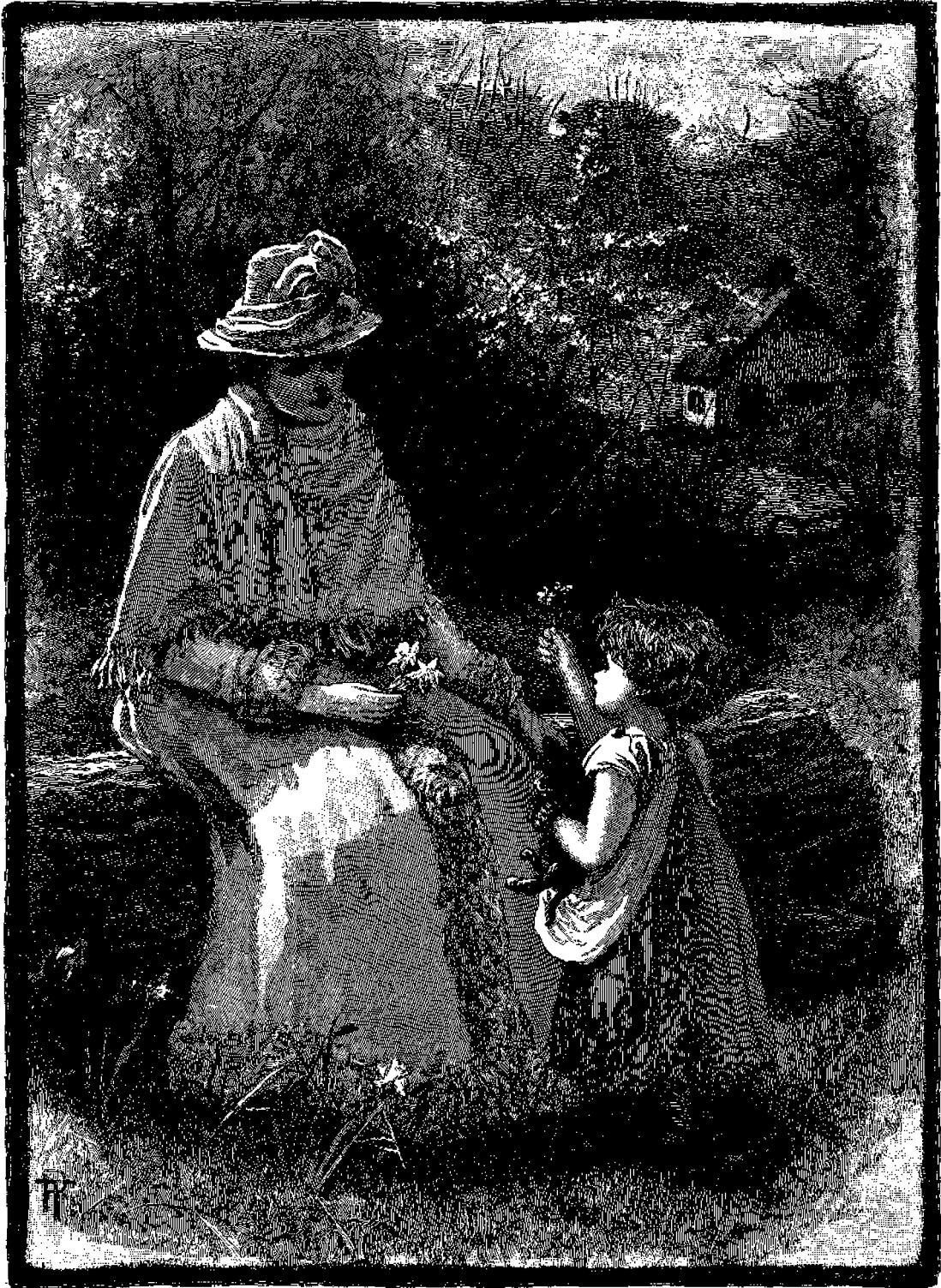
Η ἀναγιγνωσκουσα μητήρ.