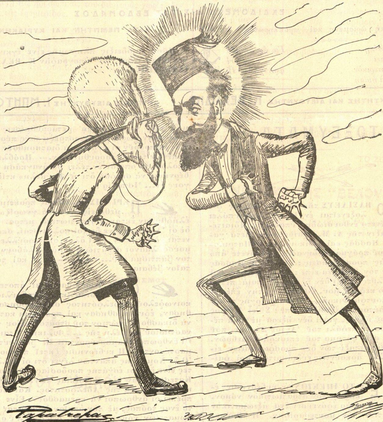
ΟΙ ΔΥΟ ΦΙΛΟΙ