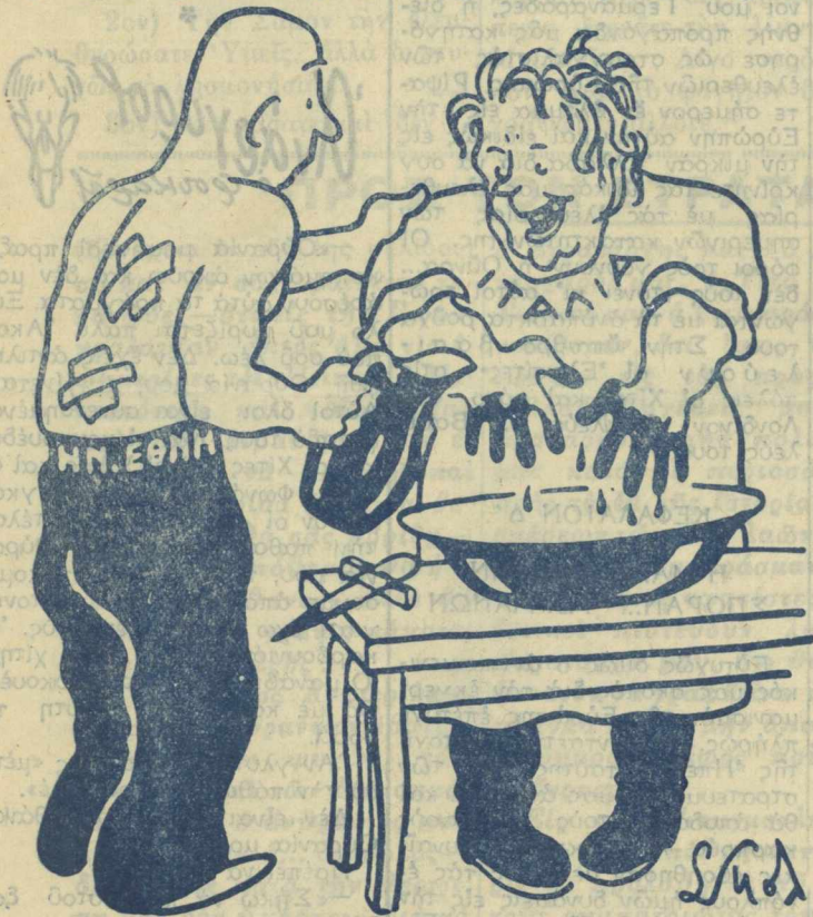
Θὰ τὸ δοῦμε κι' αὐτό;