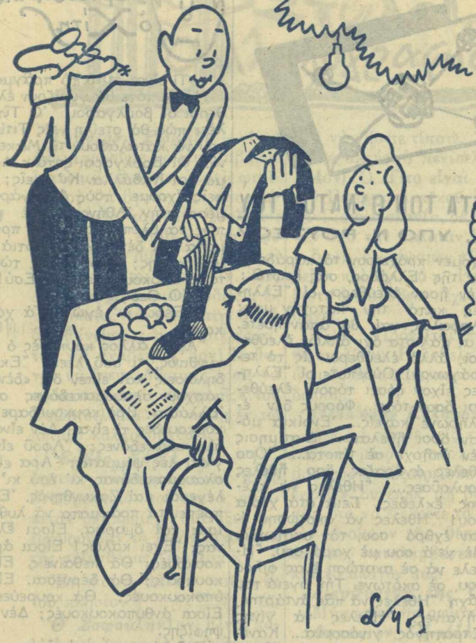
— 'Ορίστε τὰ ρέστα σας, κύριε.