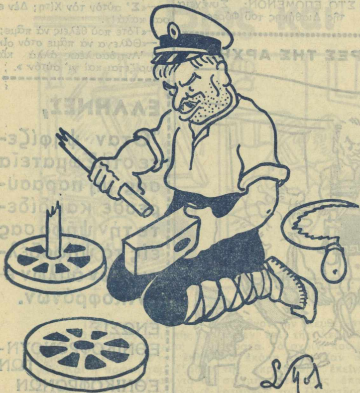
— Μιά και ἔσπασε ὁ ἄξων και δὲν μοῦ χρειάζεται πιά, ἄς κάμω ἓνα σφυρί.