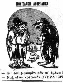
Κι' εσύ φιγουρίνι σάν κι' έμένα ! Ναί, είναι κρεασίν ΟΥΝΡΑ 1945

Όρα 12 και 5.—'Τέλος τού 'Ελληνικού προγράμματός.