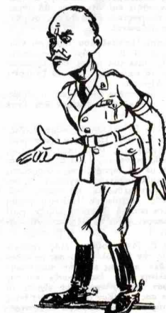
—Θά γελᾶσαι καλά, δεισιος γέλοση τελευταῖος!