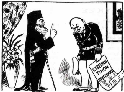
ΑΝΤΙΒΑΣΙΛΕΥΣ—Πρόσχε, κύριε Βούλγαρη, σάν ναύαρχος πού εἶσαι μὴ μοῦ τὰ κάνεις... θά λασσα!