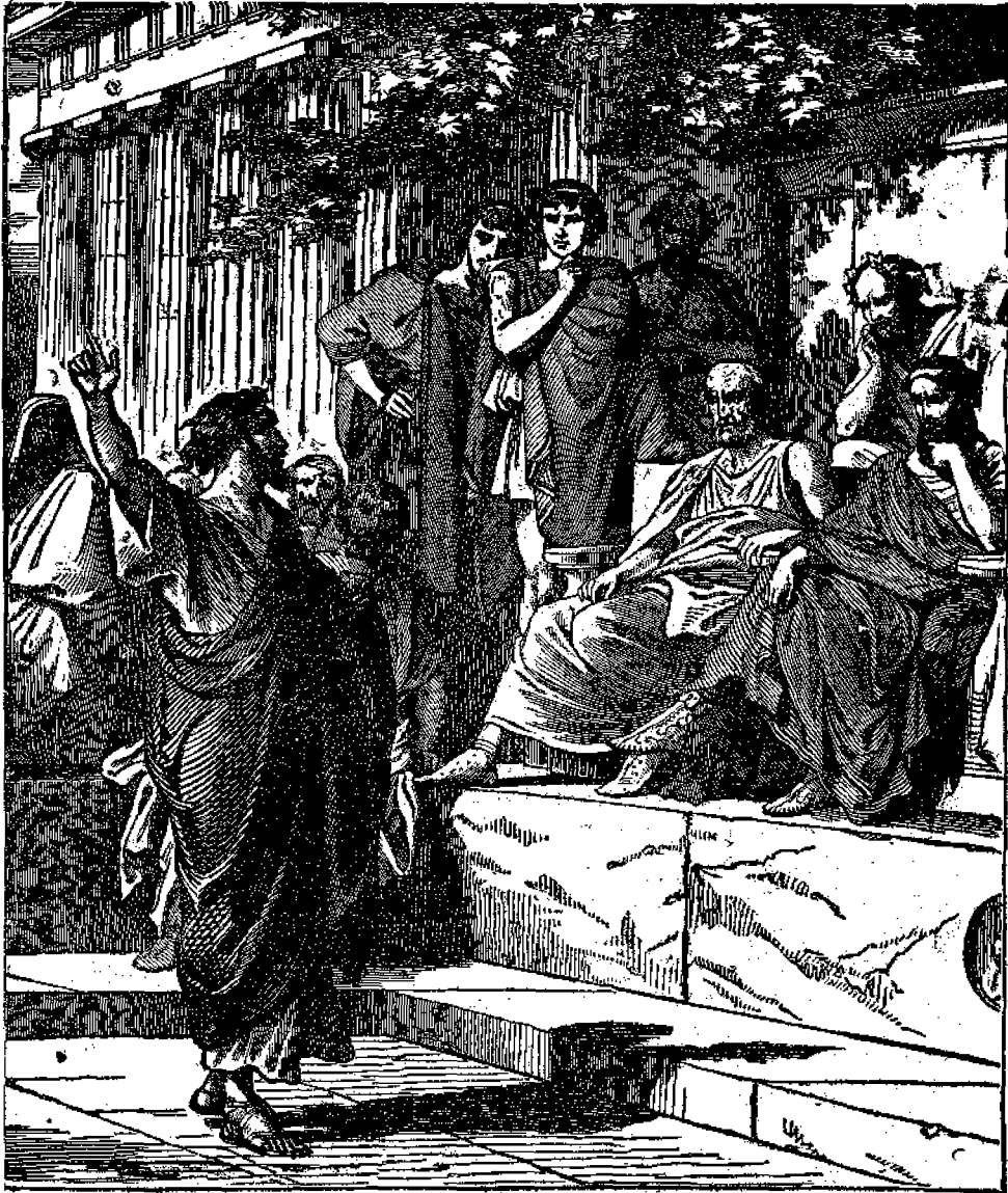
Ο ΠΑΥΛΟΣ ἐνώπιον τοῦ ΚΑΙΣΑΡΟΣ.

διὰ νὰ ἀφήσῃ τὸ σῶμα νὰ ἐνταφιασθῆ! «Οὕτως ἀπολοῦνται οἱ ἀσεβεῖς,» λέγει ἡ Γραφή, ἢ δὲ ἱστορία τοῦ κόσμου ἐπιβεβαίωσι τὴν διακήρυξίν της.