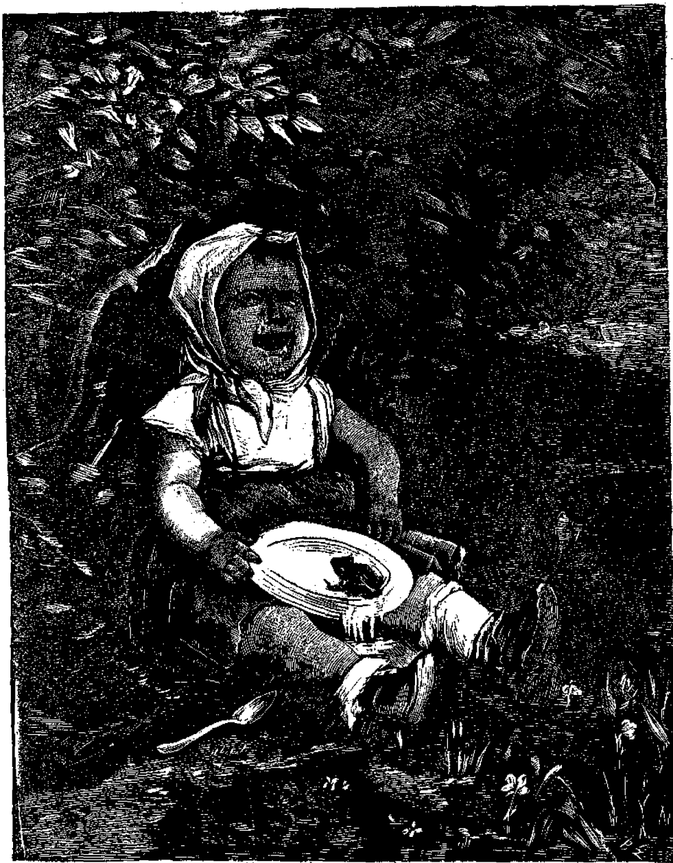
Ἡ Μαργαρίτα καὶ ὁ χυλὸς τῆς.

Τοκοθεαῖαι τινὲς εἰς τὰ περίε τῆς πόλεως πιστεύεται, ὅτι ὑπῆρξαν οἱ τόποι, εἰς οὓς διέτρυφεν ὁ προφήτης 'Ηλίας.