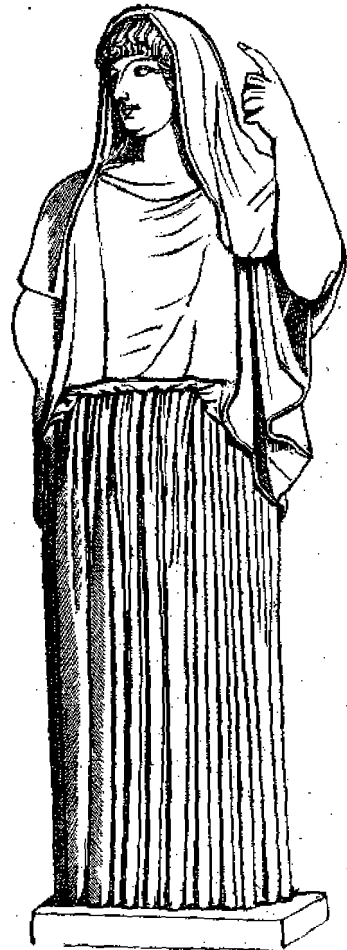
Ἡ θεὰ Ἐστία.

Σημ. Τὸ παρὸν ποιημάτων ἐγένετο ἐκ πεζῆς εἰς τὸ Ἑλλη- νικὸν ἐκ τοῦ Ἀγγλικοῦ μεταφράστως.