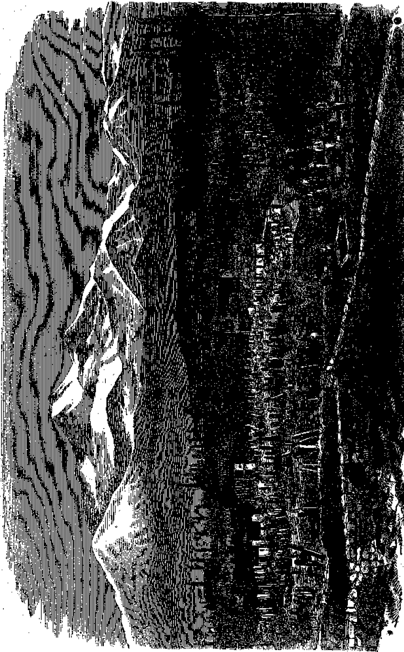
Ἡ πόλις τῆς Δαμασκοῦ.

Ἐπὶ Ἀζαρία, βασιλέως τοῦ Ἰσραὴλ ὁ βασιλεὺς τῆς Ἀσσυρίας Τυγλάθ Πελισαὲρ ἐνίκησε τοὺς Συρίους καὶ κυριεύσας κατέστρεψε τὴν πρωτεύουσάν αὐτῶν Δαμασκὸν, θέσας οὕτω τέλος εἰς τὴν Συριακὴν Μοναρχίαν.