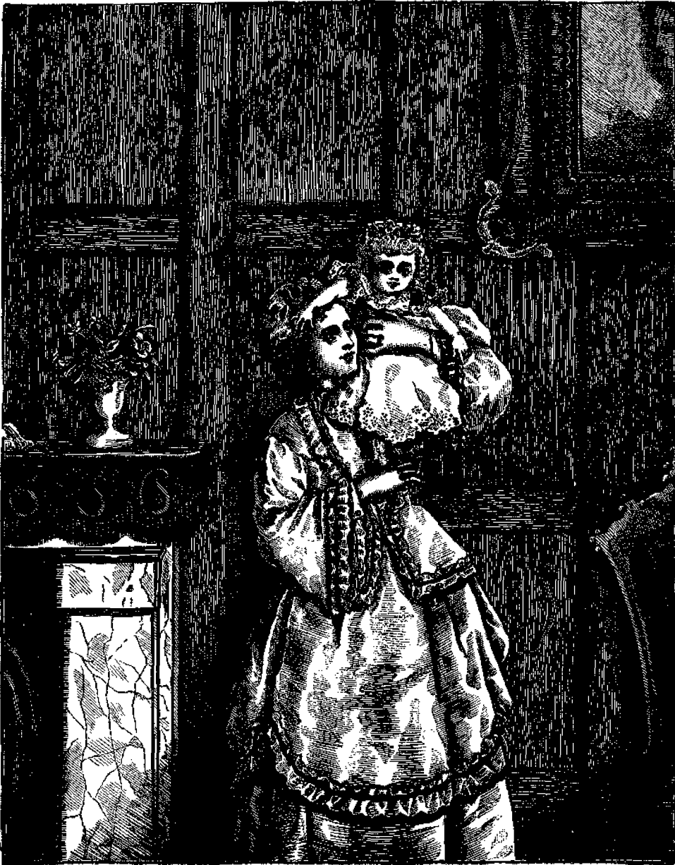
Μήτηρ διασκεδάζουσα τὸ τέκνον της.

Τώρα ποῦ γίνεταί παντοῦ μαγευτικὴ εὐωδία Και σὸν αἶθρα μυστικῶς σκοπάζεται ἁρμονία Τώρα π' ἀδάμαστη πετᾷ Και τὰ ὑπεράνθρωπα ἱερινὰ Τἀνθρώπου ἢ φαντασία.