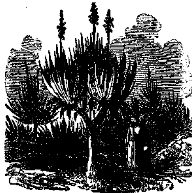
Η έν τή Γραφή Άλόη.

Τό Άγάλοχον απολαμβάνεται δι' έντομών επί του κορμού ή τών κλάδων του δένδρου, έκ τών όποιων έκρέει, και άφου έλθη εις έπαφήν με τόν άτμοσφαιρικόν άέρα πήγνυται, και συναζόμενον φέρεται εις τό έμπορίον.