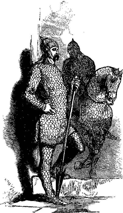
Ὀπλισμὸς κατὰ τὸν Μέσον Αἰῶνα.

Οἱ μικροὶ ἀναγνώσται τῆς Ἐφημ. τῶν Παίδων ἔχουσι ἐνώπιόν των εἰκόνα τοῦ Ὀπλισμοῦ, τὴν ὁποῖον ἔφερον οἱ λεγόμενοι ἱπποτάι, ἧτοι ἥρωες τοῦ Μεσαιῶνος συνίστατο δὲ ὁ Ὀπλισμὸς οὗτος ἐκ δικτυωτοῦ θώρακος καὶ περισκελίδων, κατεσκευασμένων ἐκ σιδήματος, ἢ μεταλλίνων πλακῶν, τῆς μῖαε ἐπὶ τῆς ἄλλης καθ' ἕνα τρόπον τὰ λέπια τῶν ἰχθύων.