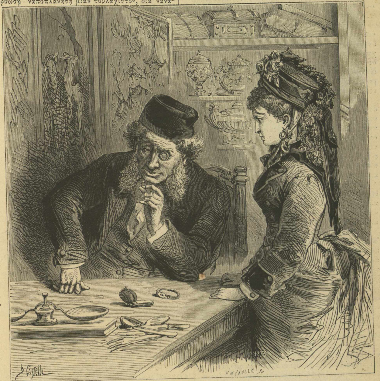
Πόσον θὰ τὰ ἐκτιμήσῃ;...

παύσῃ τὴν συνείδησίν της και νὰ ἔχῃ νὰ λέγῃ ὅτι δὲν ἐγένετο αὐτὴ και μόνη θύμα, ἀλλ' ὅτι ἔχει και ἄλλας θυμίας αὐτῆς ὁ κόσμος!