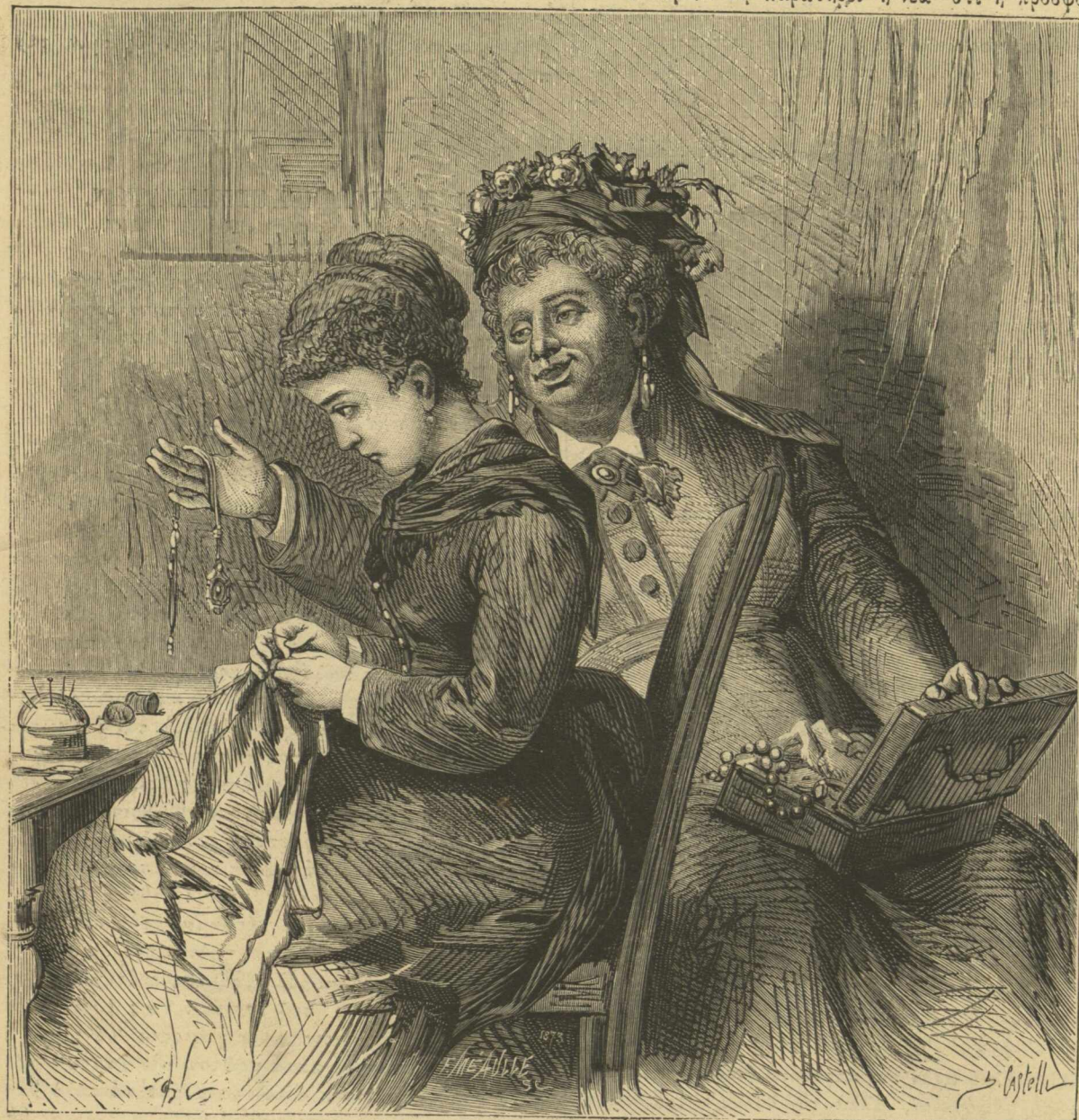
Πόσον θὰ τῆ τὰ πωλήσῃ;...

νότερον. Τὰ βλέματα τῆς νέας εἶνε και πάλιν προσηλωμένα ἐπὶ τῶν κοσμημάτων και φαίνονται ὡς νὰ λέγωσι «πόσον ἀρὰ γε θὰ τα ἐκτιμήσῃ.» Πόσον; — Τόσον ἀξίζουσι, τῆ λέγει ἀταράχως ὁ ἐκτιμητῆς και ἐκβάλλει ἐκ τοῦ στόματός του εὐτελεστάτην τιμὴν. Τῷ παρατηρεῖ ἡ νέα ὅτι ἡ προσφορά