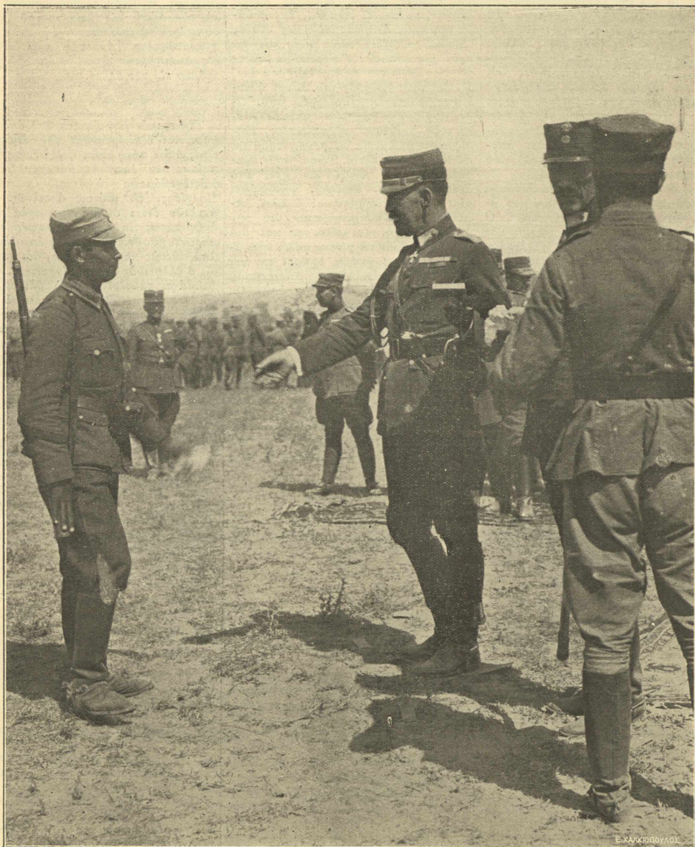
ΜΕΓΑΛΑΙ ΙΣΤΟΡΙΚΑΙ ΣΤΙΓΜΑΙ.— Ἡ Α. Μ. ὁ Βασιλεὺς Κωνσταντῖνος παρασημοφορῶν τοὺς ἡρώας μας.