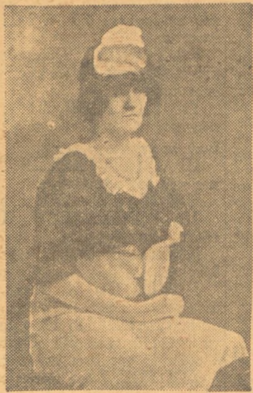
Μία καὶ μοναδικὴ εἰκὼν τῆς καθαριστριάς τῆς «Παπαρούνας», ἢ ὅποια ἔχει ἀναλάβει τὸ εἰνεργητικὸν ἔργον τῆς ἐκκαθάρσεως τῆς πρὸς δημοσιεῖσιν ἀποστελλομένης ἡλῆς, πού τὸ πλεῖστον μέρος τῆς λαμβάνει τὴν ἄγουσαν εἰς τὸν κάλαθον τῶν ἀζητήτων. Εἰς τὴν φωτογραφίαν: Ἡ καθαρίστρια τῆς «Παπαρούνας» μὲ στολὴν ὑπερσείας, μετὰ τὴν λήξιν τοῦ εβδομαδιαίου τῆς ἔργου.