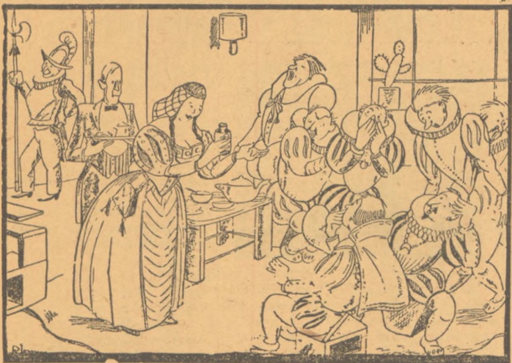
Ἡ Λουκρητία Βρυγία στὸς προσκεκλημένους της: Μὲ γάλα ἢ με τσάι παίρνετε τὸ δηλητηριώδες; (Ἀπὸ τὸ ἰταλικὸν περιοδικὸν «Τρα βάσο ντέλλε Ἰντέε»).