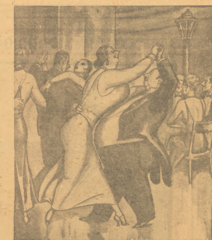
Ἡ ντᾶμα στὸν καθ' ἑαυτὸν ἑρῶτα. — Το κισθάνεσθε, κ. Καρπουζόπουλε, ὅτι ἐμεῖς οἱ δυὸ εἴμαστε τὸ πεῖδ εὐάρμοστο ζευγάρι τοῦ κόσμου;

κάθε φορά! Βασιλεὺς Γεώργιος. — Ὅχι, Μαρία. Κάθε βδομάδα καὶ ἀνεβαίνει λιγάκι. Βασίλισσα Μαρία. — Ξέρεις, Γεώργιο, ὁ πρίγκηψ τῆς Οὐαλλίας ἀρχισε καὶ στέλνει τὰ ρούχα του στὴ μουγαδά τοῦ σπιτιοῦ. Ἔτσι εἰκονομαεῖ τὰ λεφτὰ γιὰ τὰ ταγῖάρα του. Βασιλεὺς Γεώργιος. — Ναι, ξέρω. Μὰ αὐτὸ τὸ κονδύλι τῶν 2.000 λιρῶν γιὰ ποικάμισα... Τί ποικάμισα εἶν' αὐτά ; Βασίλισσα Μαρία. — Εἶνε οἱ 5.000 ἄσπρα ποικάμισα μετὰ τὶς πέρλες. Θυμάσαι... Βασιλεὺς Γεώργιος. — Μὰ μόλις τὰ εἶχα ἀγοράσει καὶ ἦταν ὀλωσθιδίλου ἀφόρετα... Βασίλισσα Μαρία. — Τὰ