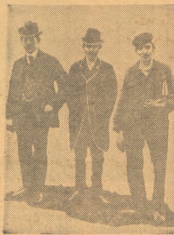
Οἱ μπάδοι τῆς «Παπαρούνας». — Ἐπειδὴ κατὸ τὸ τρίμηνον περὶ τοῦ διάστημα ἀπὸ τῆς ἐκδόσεώς τῆς ἢ «Παπαρούνας» ἔχει ἀποκτήσει ἀπείρους ἐχθροὺς — καὶ εἶνε ἐχθροὶ τῆς οἱ ἀπειροὶ ἀναγνώσται τῆς — ἀναγκάζεται νὰ λάβῃ τὰ μέτρα τῆς. Καὶ ἀπὸ ὀλίγων ἡμερῶν ἔχει τοποθετήσῃ ἐμπρὸς εἰς τὴ γραφεῖα τῆς τρεῖς μπάδους, πού εἶνε ἐτοιμοὶ νὰ σκοτώσουν ἀνηλεῶς ὅποιονδήποτε ἐδοκίμαζε νὰ δημοσιεύσῃ διὰ τῆς βίας τὴν συνεργασίαν του εἰς τὴν «Παπαρούνα».