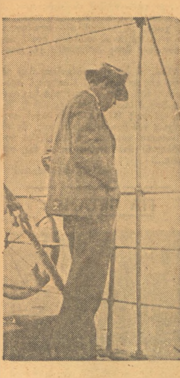
Ἀπὸ τὴν ἐκ Πειραιῶς διέλευσεν τοῦ τέως προέδρου τῶν Ἠνωμένων Πολιτειῶν κ. Χούβερ.— Ὁ κ. Χούβερ ἐπ' τοῦ καταστρώματος τῆς θαλαμηγού του.