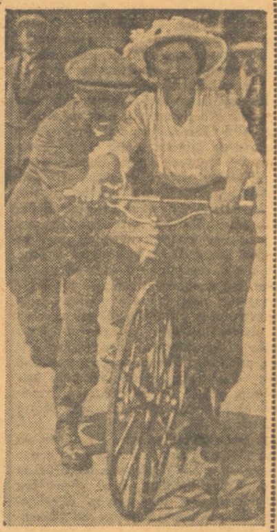
Αἱ Ἀτθίδες καὶ τὰ σπόρ.— Συμπαθητικὴ Ἀτθὶς καθ' ἣν στιγμὴν μαθαίνει ποδηλάτον, τὸ εὐγενὲς σπόρ τῆς ἐποχῆς.