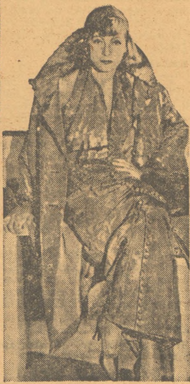
Ἀπὸ τὴν δεξ' Ἀθηναίων διέλευσεν τῆς γοήσεως τοῦ σνεμά Γκρετὰς Γκάρμπο