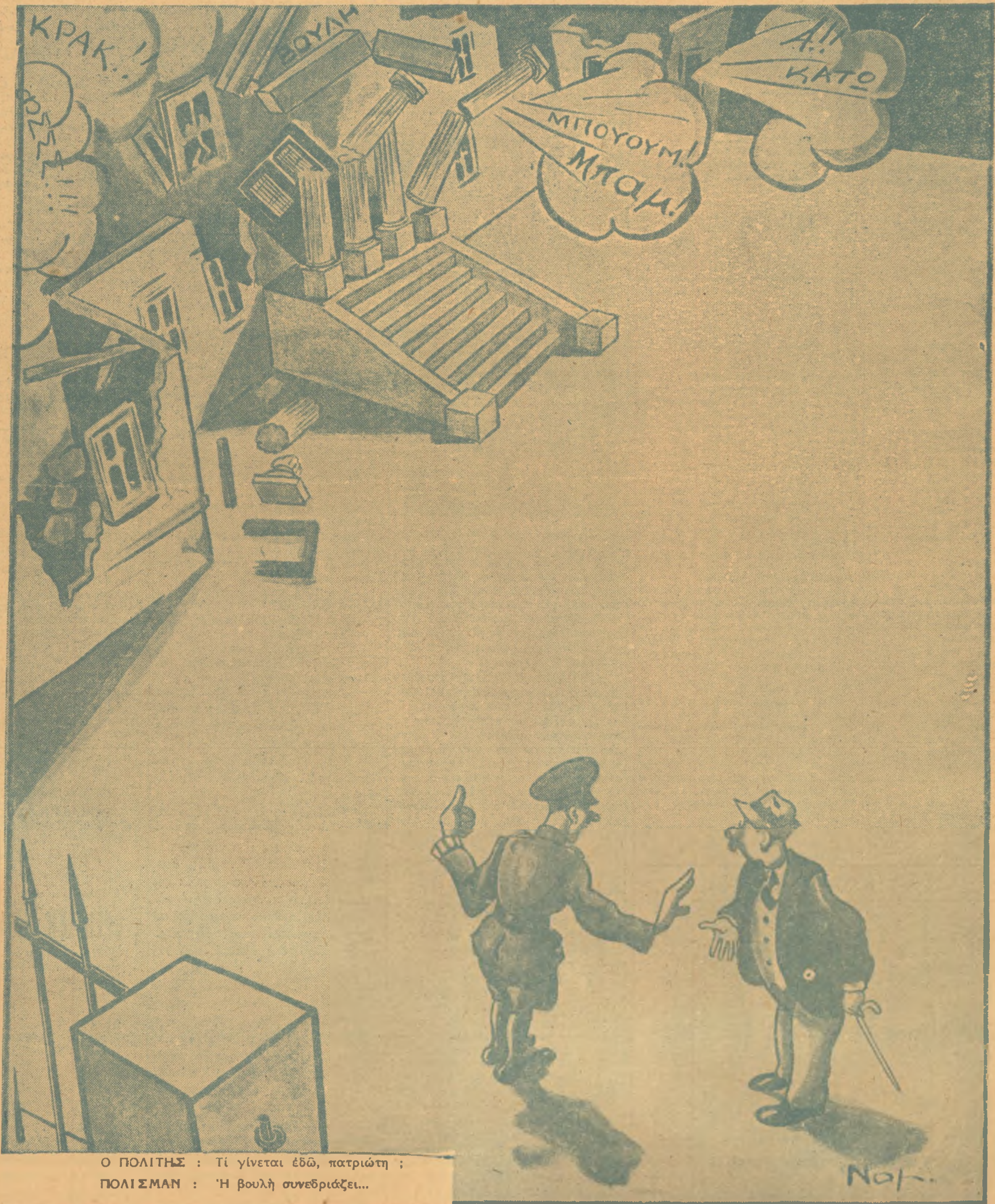
Ο ΠΟΛΙΤΗΣ : Τί γίνεται έδω, πατριώτη ; ΠΟΛΙΣΜΑΝ : 'Η βουλή συνεδριάζει...